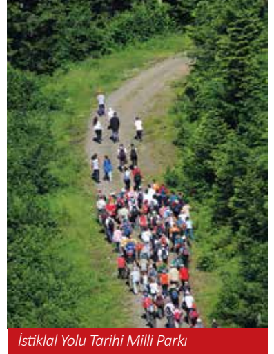
İstiklal Yolu Tarihi Milli Parkı

Kastamonu, Ilgaz Dağı Milli Parkı, Küre Dağları Milli Parkı ve İstiklal Yolu Tarihi Milli Parkı olmak üzere sınırları içerisinde toplamda üç tane milli park bulunan, Türkiye'nin nadir illerinden biridir. Kastamonu zengin flora ve faunası ile Türkiye'de yetişen bitki ve hayvan türlerinin büyük çoğunluğuna ev sahipliği yapmaktadır. Öte yandan ülkemizde endemik olan 65 familyanın %54'ü, endemik cinslerin %32'si ve endemik türlerin %10'u Bölgede bulunmaktadır.