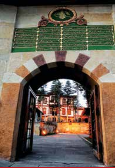
Hz. Pir Şeyh Şaban-ı Veli