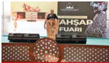
Kastamonu Ahşap Fuarı

Ağaç ve ağaç işleri ürünlerinde de sektörde hatırı sayılır bir yere sahip olan Kastamonu her yıl düzenlediği ahşap fuarı ile sektör ilgililerini ağırlamaya devam etmektedir. Fuar Kastamonu'nun ahşap ve ağaç ürünlerinin tanıtımını yapmak, bu sektörde faaliyet gösteren firmaların kendilerini tanıtarak satış hacimlerini geliştirmek ve ziyaretçilerine Kastamonu'yu tanıtmak amacıyla düzenlenmektedir. Stantlarda ahşap el oyma, mobilya, ahşap dekorasyon, masif ahşap ve ahşap endüstriyel ürünler sergilenmektedir. Ayrıca özel