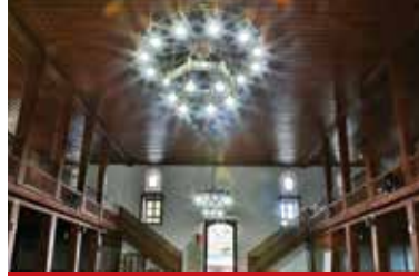
Atabey Gazi Camii ve Türbesi