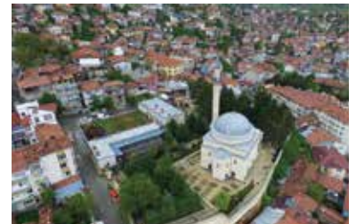
Yakup Ağa Külliyesi