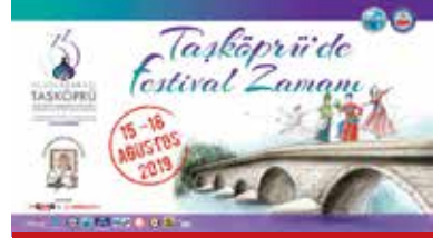
Uluslararası Taşköprü Kültür ve Sarımsak Festivali

sanat dallarından olan ve titizlikle hazırlanan ahşap işlecilik ve oyuncacılık eserleri de yer almaktadır.