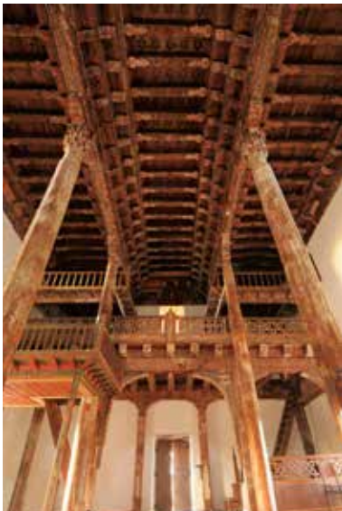
Kasaba Köyü Mahmut Bey Camii

Yılanlı Külliyesi, kapısındaki "Her şeye şifa arayan ancak ölüm müstesnadır." yazısı ile bilinir. Anadolu'nun ilk şifahanesi ve ilaç yapım yeridir.