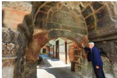
Yılanlı Külliyesi (Darüşşifası)

1506 yılında dönemin kadısı Nasrullah Kadı tarafından yaptırılan Nasrullah Camii kent merkezinde konumlanmıştır. Şadırvanından şu içenlerin 7 vakitte yeniden Kastamonu'ya geleceği rivayet edilir.