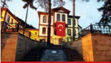
Şeyh Şaban-ı Veli ve Kastamonu Evliyalarını Anma Haftası