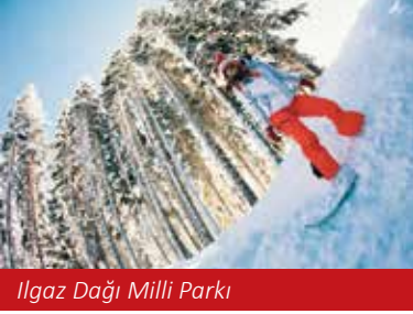
Ilgaz Dağı Milli Parkı