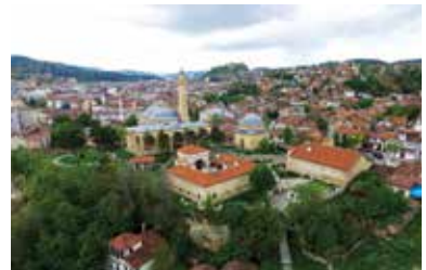
İsmail Bey Külliyesi

14. yüzyılda yaşayan Candaroğlu İsmail Bey bu külliye yapıtıdır. Rivayete göre, İsmail Bey Külliyesinin içerisinde yer alan türbenin giriş kapısının üstündeki kemere uzaktan bakıldığında İsmail Beyin kendisi, yakından bakıldığında ise çiçek deseni görüldüğü belirtilmektedir. İs-