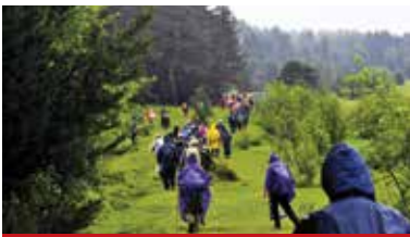
Atatürk ve İstiklal Yolu Yürüyüşü

Kurtuluş Savaşında Kastamonu halkının yapmış olduğu fedakârlıkları anmak ve "İstiklal" in kazanılması yolunda verilen mücadeleyi gelecek kuşaklara aktarılmasını sağlamak amacı ile her yıl Kastamonu - İnebolu arasındaki 95 km'lik "İstiklal Yolu Yürüyüşü" gerçekleştirilmektedir. İstiklal Yolu yürüyüşü, İnebolu Türk Ocağı önünden başlayarak 4 gün sürmekte olup, Kastamonu Cumhuriyet Meydanı'nda sona ermektedir.