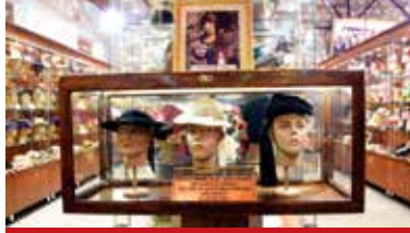
Atatürk'ün Kastamonu'ya Gelişi Şapka ve Kıyafet İnkılabı Kutlamaları