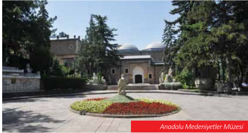
Anadolu Medeniyetler Müzesi

Ankara Devlet Resim Heykel Müzesi bünyesinde, daimi sergilerin