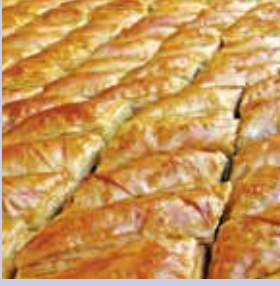
80 Katlı Baklava