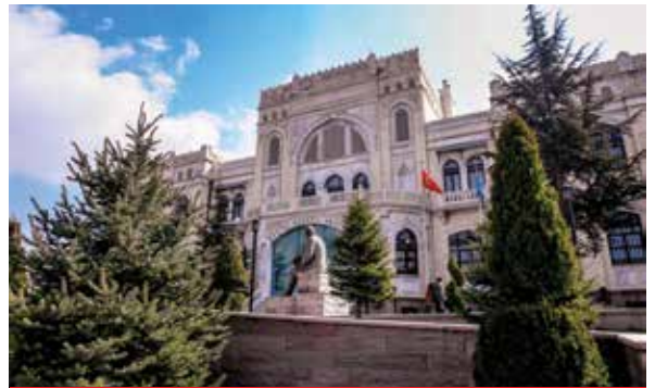
Resim Heykel Müzesi