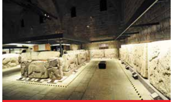
Anadolu Medeniyetler Müzesi