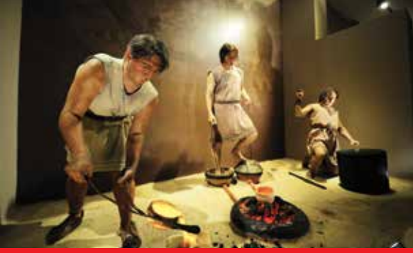
Anadolu Medeniyetler Müzesi