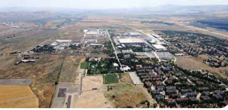
Türk Uçak Sanayii Anonim Ortaklığı (TUSAŞ)