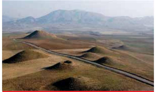
Gordion Müzesi / Tümülüsler