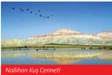
Nallıhan Kuş Cenneti

Turizm işletme belgeli konaklama tesislerindeki salon kapasitesi 35.665 kişi, kamu ve sivil toplum kuruluşlarındaki salon kapasitesi 28.239 kişi, inşaatı devam eden salonlar 4.093 kişi olup toplam 67.997 kişidir.