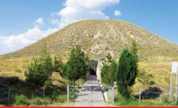
Gordion Müzesi / Büyük Tümülüs