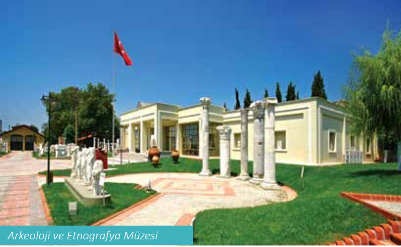
Arkeoloji ve Etnografya Müzesi

Kültür ve Turizm Koruma ve Gelişim Bölgesi bulunmaktadır. Bunlar Kocaeli Sakarya Kıyı Bandı KTKGB ve Kocaeli Kartepe KTKGB'dir. Bu bölgelerde yapılan turizm yatırımları, 5. Bölge illerde sağlanan teşviklerden yararlanabilmektedir.