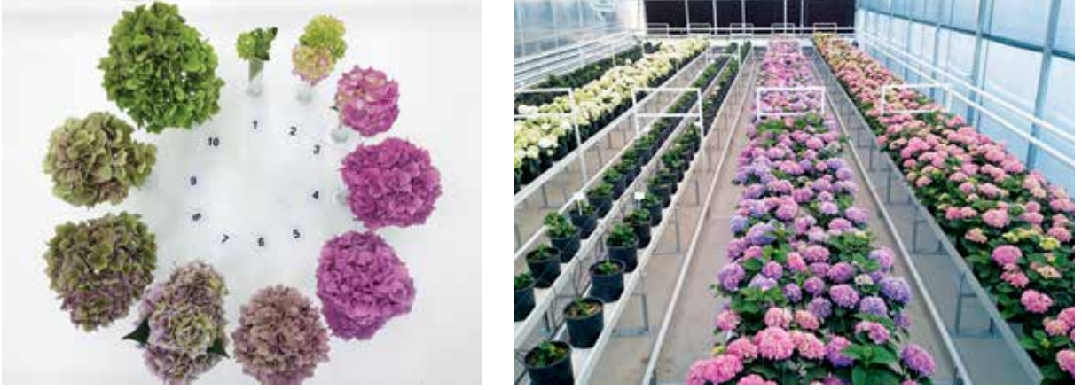
Şekil 2. Ortancada çiçeğin gelişim aşamaları (solda), Ankara Üniversitesi Ziraat Fakültesi Bahçe Bitkileri Bölümü Ar-Ge serasında kesme çiçek ortanca yetiştiriciliği (sağda)

adet bazında %56.4 (36.6 milyon dal), ciro bazında %92.7 (44.4 milyon Euro) oranında artış göstermiştir. Dal fiyatı ise aynı dönemde %23 artarak 1.22 Euro'ya yükselmiştir.