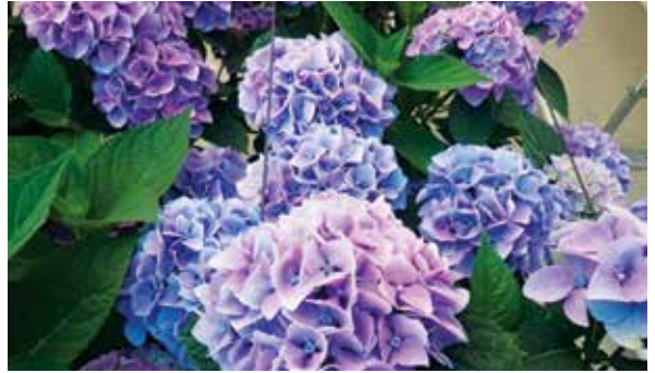
Şekil 6. Ticari ortanca çeşitleri, Ankong Rose (solda), Ankong Blue (sağda)