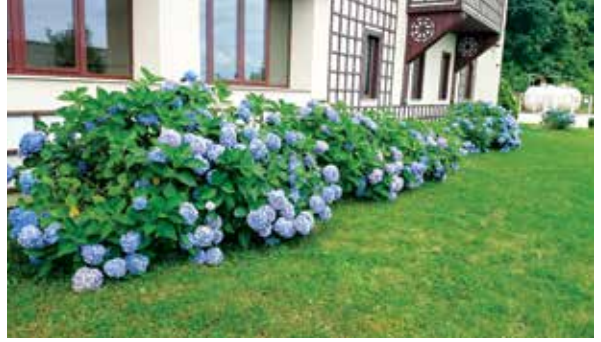
Şekil 5. Rize'nin Pazar (solda) ve Derepaşarı (sağda) ilçelerinde ortancalar