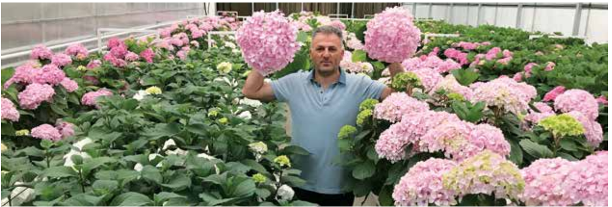
Şekil 7. Ordu ili parklarından temin edilip kesme çiçek olarak yetiştirilen ortancalar