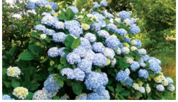
Şekil 4. Samsun (solda) ve Rize (sağda)'de ortanca bitkilerinden görünüm