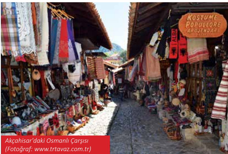
Akçahisar'daki Osmanlı Çarşısı

bunu yapabilirsiniz. Şehre daha da yukarıdan bakmak istiyorum diyorsanız teleferikle Dajti dağına çıkabilirsiniz. Dajti'ye ulaşım şehrin merkezi sayılabilecek bir noktadan hareket eden teleferiklerle olduğu için çıkması hem kolay hem de bu yeşil dağ çıktığınıza değecek güzel bir manzaraya sahip. Tekrar merkeze gelecek olursak 'Park Rinia' yani Gençlik Parkı içinde yer alan Taiwan isimli komplekste Arnavutluk'un meşhur 'trileçe'sini