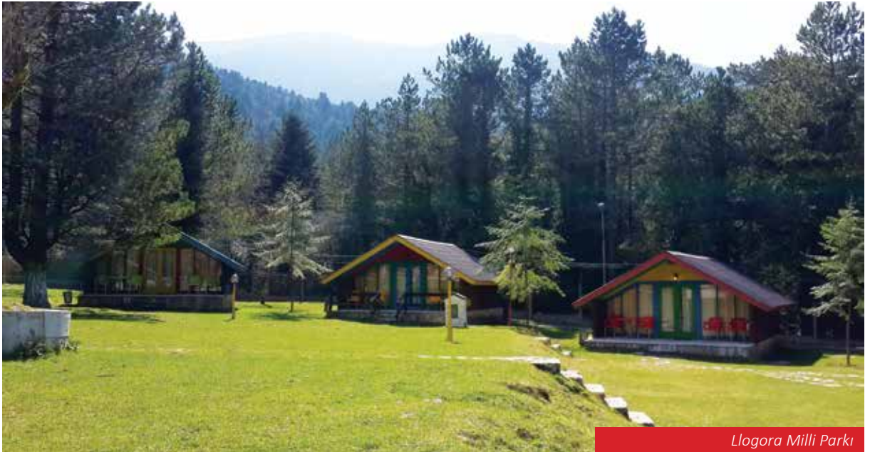
Llogora Milli Parkı

Arnavutluk benzer onlarca güzelliği keşfedecek ziyaretçilerini bekliyor.