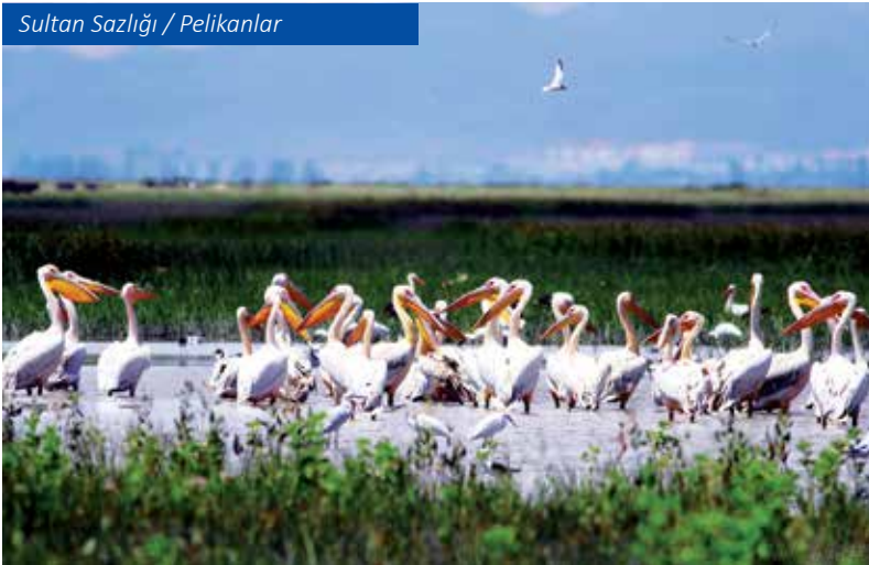
Sultan Sazlığı / Pelikanlar

Dağcılık sporu ve kış turizmi açısından önemli bir yeri vardır. Kayseri Büyükşehir Belediyesinin hayata geçirdiği Erciyes Master Planı kapsamında uluslararası standartlara kavuşan Erciyes Kayak Merkezi, Kapadokya bölgesine yakınlığı, ulaşım kolaylığı, pist uzunluğu, mekanik tesisleri, profesyonel yönetim anlayışı ve uygun fiyat politikasıyla her geçen gün daha çok ilgi çeken Erciyes Dağı, kayak severlere sunduğu imkanların yanı sıra bol oksijenli dağ havasında tatil yapmak isteyenlerin de gözdesi oluyor. Modern liftleri ve son teknoloji teleferik sistemiyle yaklaşık 25 kilometrekarelik alana yayılan kayak