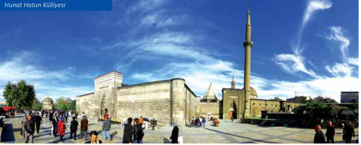
Hunat Hatun Külliyesi