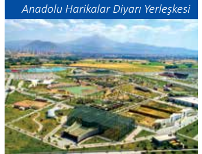
Anadolu Harikalar Diyarı Yerleşkesi