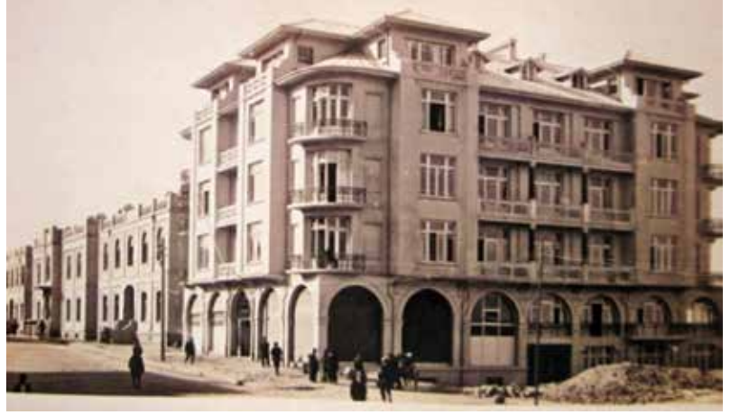
Evkaf Apartmanı, 1928, Bugünkü Küçük Tiyatro Sahnesi

Bahçelievlerin teker teker apartmana dönüştüğü örnekler çok. Bugün için bu semtte o günden kalma bir iki bahçeli evi görmek belki mümkün. Onlar da şehrin rantına teslim olur mu? Bilinmez... Ancak Jansen'in ve gerisinde Ebenezer Howard'ın bahçekentinden yalnız semtin ismi miras kalmış görünüyor.