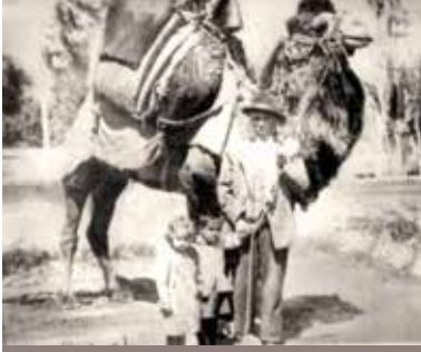
1925 yeni pazar ilçesi - Aydın'dan yarım dünya adlı tülü deve

Küçük Menderes havzasına inen yolların başındadır, bu yüzden irili ufaklı yollar buradan Tire-Beydağ'a bağlanır... Nazilli'ye ulaşan kervanlar, şehrin içinde birçok konaklama merkezinde, handa, kuyu başlarında ve kahvede mola verirlerdi; buralarda alışveriş, takas yapılır; hayvanlar ve yolcular dinlendikten sonra, kervanlar arasında İzmir'e doğru devam edecek olanlar yeniden develerini yükler ve yola çıkarlardı... Aydın-Karapınar (İncirliova) arasında birçok çeşme, sebil, kahve ve kuyu vardı... Güneye inen yol Çine çayı vadisiyle Muğla ve Milas'a veya Koçarlı yolu ile Söke'ye, oradan da küçük limanlara ve Kuşadası'na bağlanıyordu. Görece büyük bir toplanma merkezi olan Söke'den daha güneye Milas-Muğla-Yatağan'a bağlanmak da mümkündür" (Yapucu, 2007).