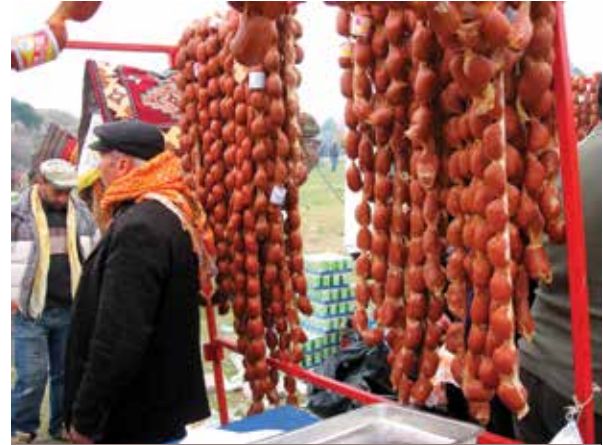
Deve sucuğu sadece Aydın'da üretilir

nakkale boğazı, batıda Ege Denizi, doğuda iç batı Anadolu eşiği ve güneydoğuda Orta Toroslar ile sınırlanır. En çok Ege Bölgesi'nde görülen deve güreşi organizasyonları, bu bölgenin denize kıyısı olmayan iki ilinde (Manisa ve Denizli) de görülür (Çalışkan, 2016).