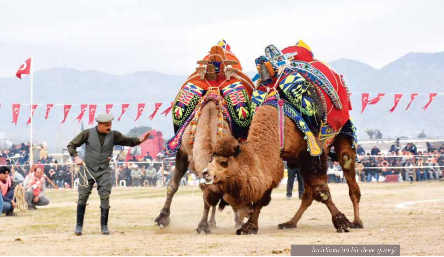
İncirliova'da bir deve güreşi

beceriler, devecilikle ilgili geleneksel üretimler ve geleneksel törenler, batı Anadolu'da adeta nesilden nesile aktarılan kültürel bir mirasa dönüşmüştür (Çalışkan, 2016).