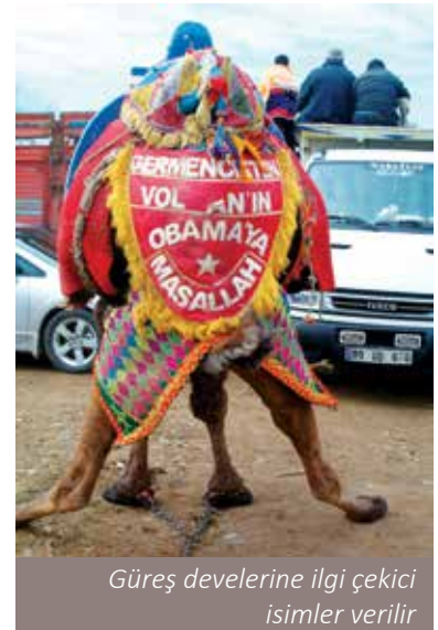
Güreş develerine ilgi çekici isimler verilir

Deve güreşlerinin yoğun bir dağılışı gösterdiği çevreler, esasen tarih boyunca önem taşımış ulaşım hatlarının üzerinde bulunmaktadır. Bilindiği gibi Ege bölgesinde demiryollarının varlığından önce, yüzyıllar boyunca önemini koruyan doğal geçitlerle bağlantılı yol sistemi kullanılmıştır. Bu yollar, Anadolu'nun iç kesimlerini kıyılarına bağlayan kervan yollarıydı. Menderes'in kollarının