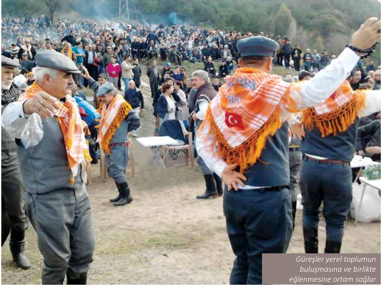
Güreşler yerel toplumun buluşmasına ve birlikte eğlenmesine ortam sağlar

oluşturduğu vadiler ve geçitler ulaşımı büyük ölçüde yönlendirmiştir. Bu nedenle en eski çağlardan beri Anadolu kıyılarının iç kesimlere bağlandığı ana yollar Menderes ve Gediz oluklarını izlemiştir (Yapucu,