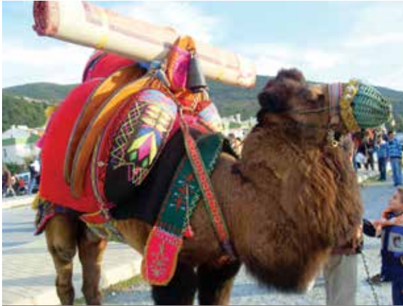
Güreşen develerin ödülü her zaman halı olmuştur.