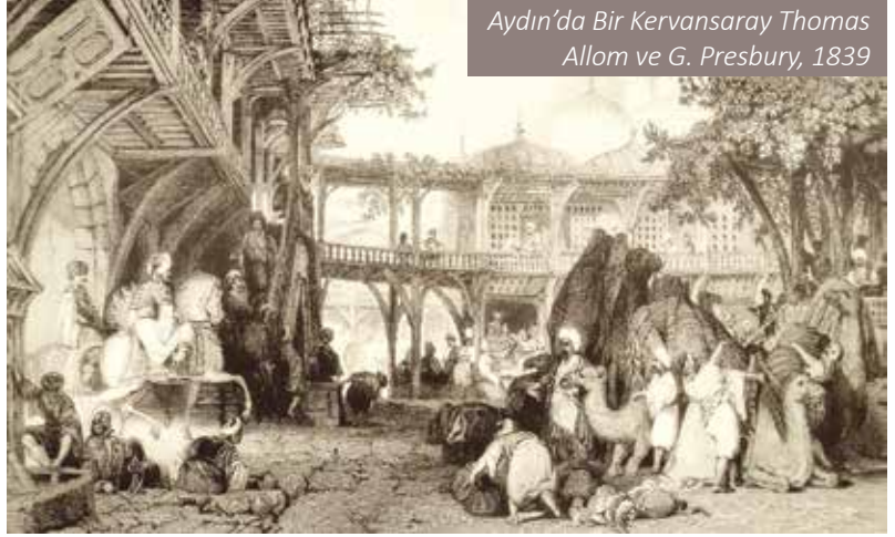
Aydın'da Bir Kervansaray Thomas Allom ve G. Presbury, 1839

Batı Anadolu'daki Yörükler arasında bilinen en önemli Yörük grupları 'Karacıyan' ve 'Buğurcıyan' Yörükleri olarak tanınmaktadır. Karacıyan'ın esasında Aydın bölgesinde bulunan Karacakoyunlu Yörüklerinin bir parçası olduğu anlaşılmaktadır. 'Buğurcıyan' adıyla bilinenler ise deve yetiştirmekle şöhret kazanmalarından dolayı bu adı almışlardır. Aydın Sancağındaki en önemli Yörük grubu 'Bayramlı Karacakoyunlusu' adıyla bilinmektedir. Ege bölümünde kurulan birçok yerleşme, batı Anadolu'da yaşayış gösteren Türkmenlerin yerleşik hayata geçmesi ile oluşmuştur. Yarı göçebe Türk topluluklarının Aydın Sancağı'nda başta Tire olmak üzere Bayındır, Ayasuluğ (Selçuk), Bozdoğan, Nazilli, Birgi, Ödemiş, Söke ve Sultanhisar çevrelerine yerleştikleri anlaşılmaktadır (Yapucu, 2007).