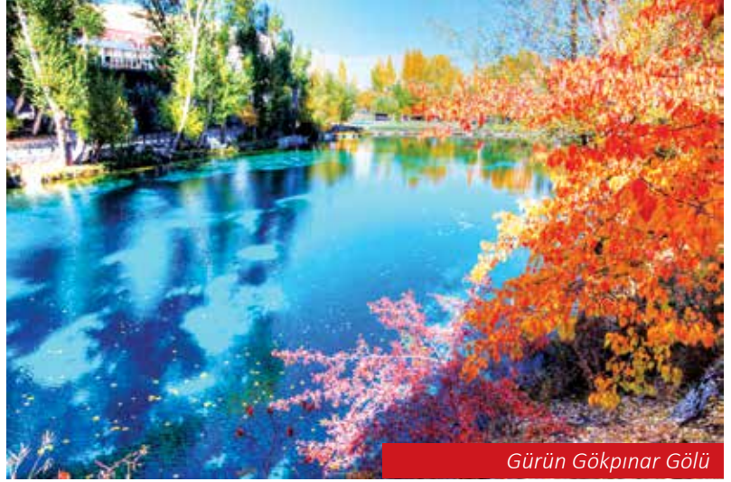
Gürün Gökpınar Gölü

duğu, Çevreyle Dost, Bölgesel Cazibe Merkezi olmuş bir şehir olabilmek. Cumhuriyetimizin kuruluşunun 100. yıldönümünde Sivas İlini nerede görmek istiyorsunuz sorusuna gelince;