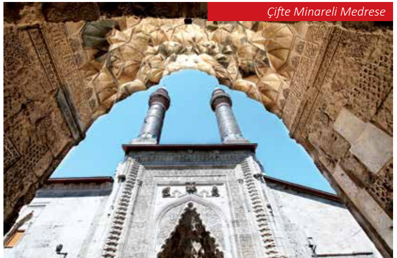
Çifte Minareli Medrese

Sivas'ı ele geçirdi. Anadolu Selçukluları ile Danişmentliler arasında sürekli el değiştiren Sivas, 1175'te II. Kılıç Arslan tarafından Selçuklulara bağlandı. Selçuklular döneminde de Sivas'ın güç savaşlarının iktidar kavgalarının içinde olduğunu görü-