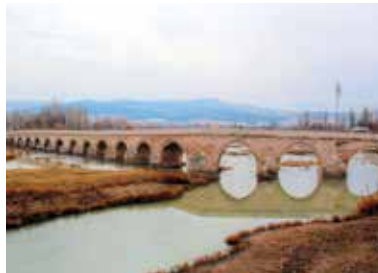
Tarihi Eğri Köprü