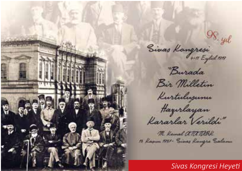
Sivas Kongresi Heyeti

Sivas Kongresi bir milletin yeniden uyanış günüdür. O gün, Gazi Mustafa Kemal ATATÜRK ve arkadaşları,