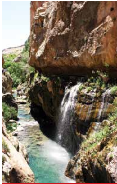
Grn Şuđul Kanyonu

Sadece bu belirttiğim bile Sivas'ımızın potansiyeli hakkında kısa bir bilgi vermiştir umarım. Bunun yanı sıra gelenekleri, grenekleri, halısı, kilimi, yemekleri, el sanatları da ayrı birer başlık olarak deđerlendirilebilir.