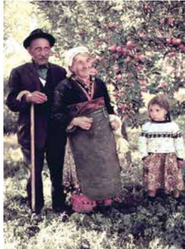
Aşık Veysel Şatroğlu

Sivas'ın Şarkışla ilçesi Sivrialan köyünde dünyaya gelmiştir. 21 Mart 1973'te yine Sivrialan'da hayata gözlerini kapamıştır. Her yıl ölüm yıl dönümünde Sivrialan'daki kabri başında büyük ozanımızı anarız.