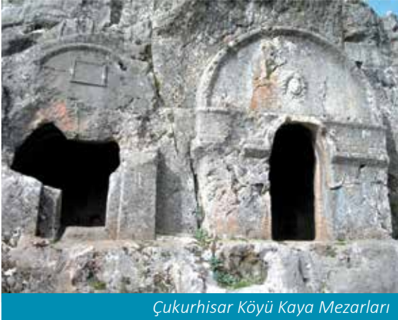
Çukurhisar Köyü Kaya Mezarları