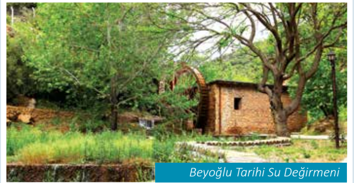
Beyoğlu Tarihi Su Değirmeni