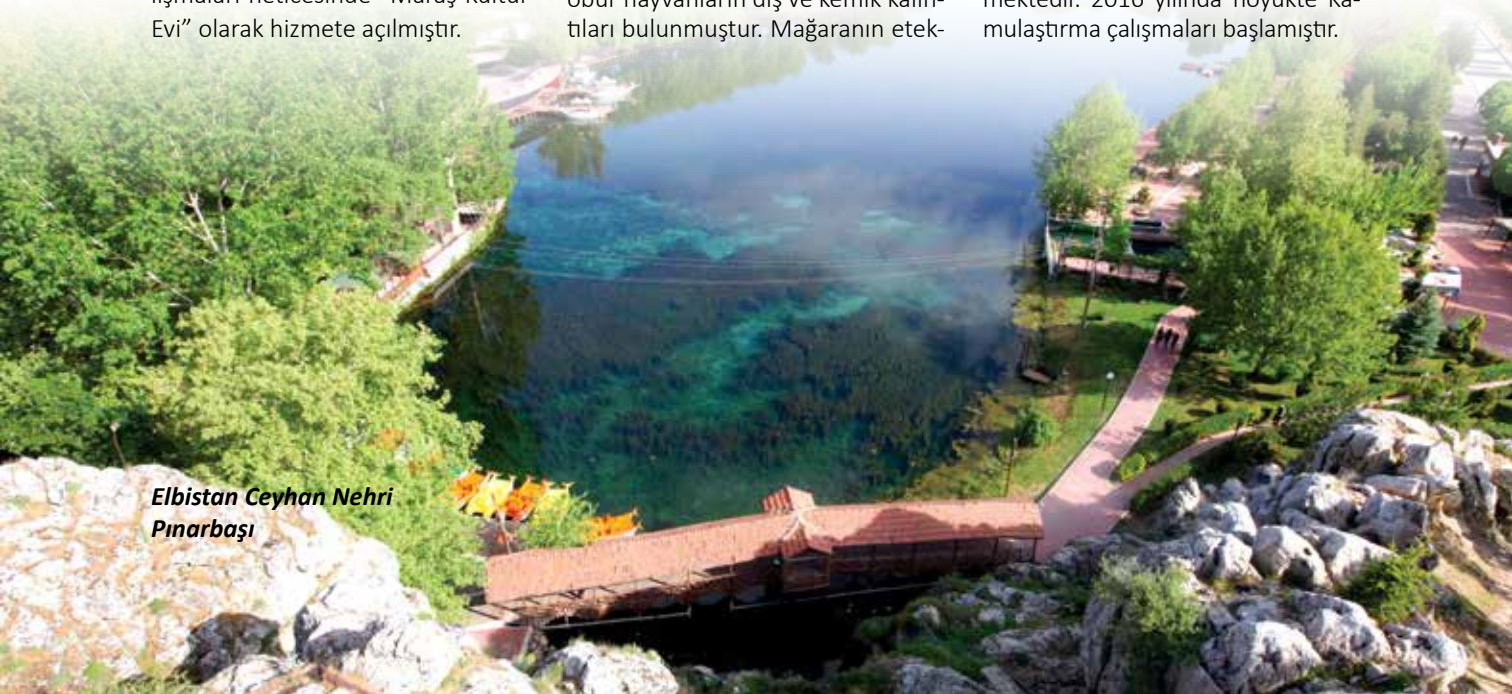
Elbistan Ceyhan Nehri Pınarbaşı

Karahöyük, ovanın merkezinden geçen doğu batı ile kuzey güney yönünde ki yolların merkezinde ve Hurman Suyu'na yakın konumu ile ovaya hakim konumdadır. Karahöyüğün, Elbistan Ovası ve civarında ki yerleşmeleri kendi stratejik konumunu kullanarak büyük ihtimalle kontrol ettiği ve egemenliği altına aldığı görülmektedir. Bu sebeple dolayı ovadaki yerleşmelerin büyükleri değerlendirildiğinde ve aynı zamanda Karahöyüğün 10,5 hektarlık büyüklüğü ile ovanın en büyük yerleşim yeri olduğu görülmektedir. 2016 yılında höyükte Kamulaştırma çalışmaları başlamıştır.