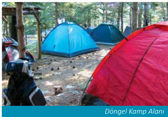
Döngel Kamp Alanı