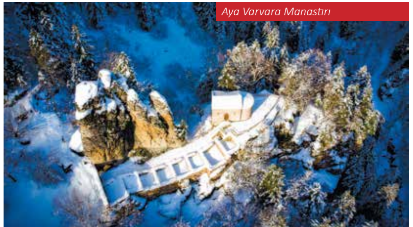
Aya Varvara Manastırı

Kesin kuruluş tarihi bilinmeyen eser, mimari ve süsleme özelliklerinden