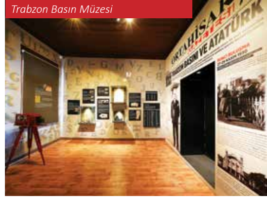
Trabzon Basın Müzesi

Yüzyıl Trabzon'una ait dokümanter filmler, Trabzon basınına ilişkin klişe ile orijinal gazete ve dergiler, Milli Mücadele ve erken Cumhuriyet Dönemlerine dair binlerce tarihi ve ticari belge yer almaktadır. Trabzon'un yakın tarihine ışık tutacak nitelikte görsel ve yazılı belgeler arasında Gazi Mustafa Kemal'in ıslak imzalı yazısı da mevcuttur.