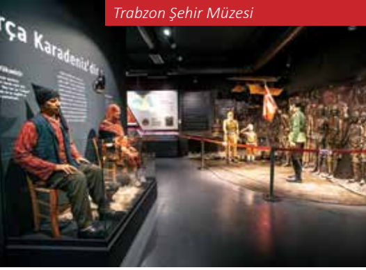
Trabzon Şehir Müzesi