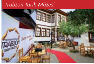
Trabzon Tarih Müzesi

1916-1918 Rus işgali yıllarında işgal kuvvetleri karargâhı olarak kullanılan bina, daha sonra Nemlizadeler tarafından satın alınmıştır. 1927'de kamulaştırılan bina, Hükümet Konağı, Üçüncü Genel Müfettişlik ve Kız Sanat Okulu olarak kullanıldıktan sonra müzeye dönüştürülmek amacıyla Kültür Bakanlığına devredilmiştir. Bakanlıkça restorasyona alınan yapının restorasyonu tamamlanma aşamasında olup 2025 yılında tekrar müze olarak faaliyet gösterecektir.