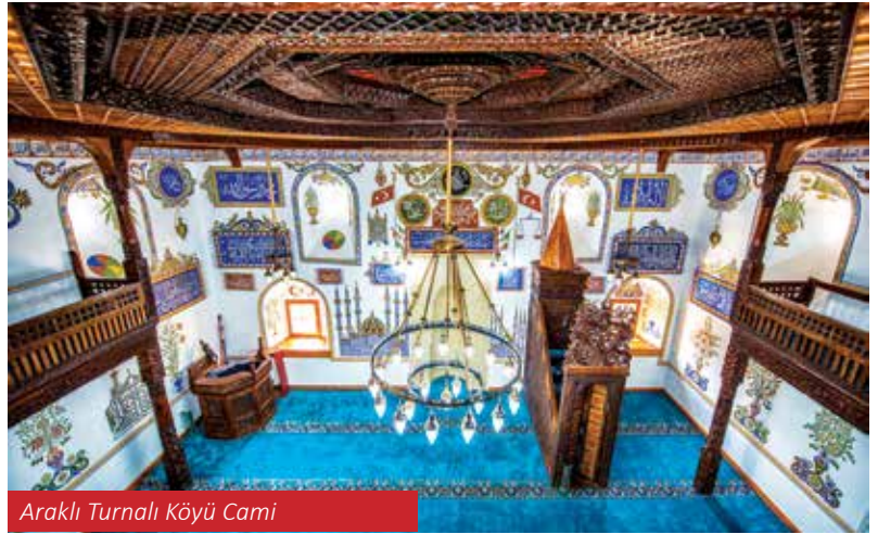
Araklı Turnalı Köyü Camii