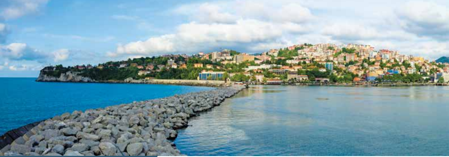
Zonguldak Liman Girişi Mendireği

Zonguldak, tarihte adı çok geçen bir ilimizdir. Bu bağlamda ilin tarihsel geçmişinde öne çıkan dönüm noktalarından bahsedebilir misiniz?