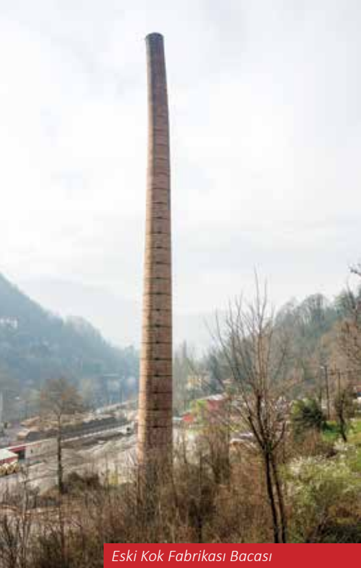
Eski Kok Fabrikası Bacası

ye'de maden mühendisliği eğitimi- nin başladığı ilk şehir olma özelliği taşıır. Daha sonra 1992 yılında Bülent Ecevit Üniversitesi'nin kurul-