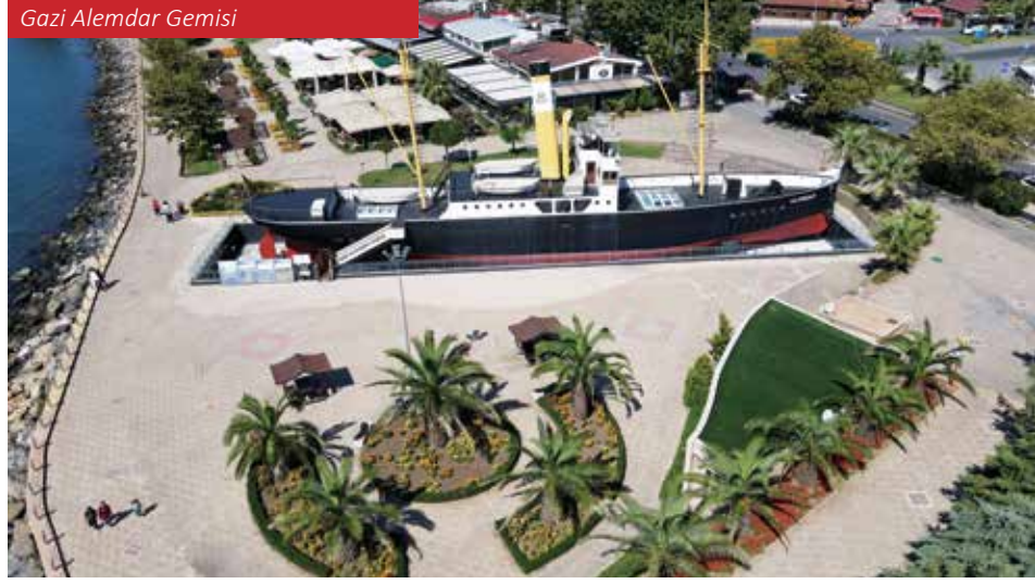
Gazi Alemdar Gemisi

Zonguldak, Karadeniz'in doğal ve bakir plajlarıyla kıyı turizminde de güçlü bir potansiyele sahiptir. Türkali, Göbü ve Filyos plajları, hem deniz tutkunları hem de sakin bir atmosfer arayanlar için ideal destinasyonlardır. Filyos kıyısındaki antik liman kalıntıları ise bölgenin tarihî ve do-