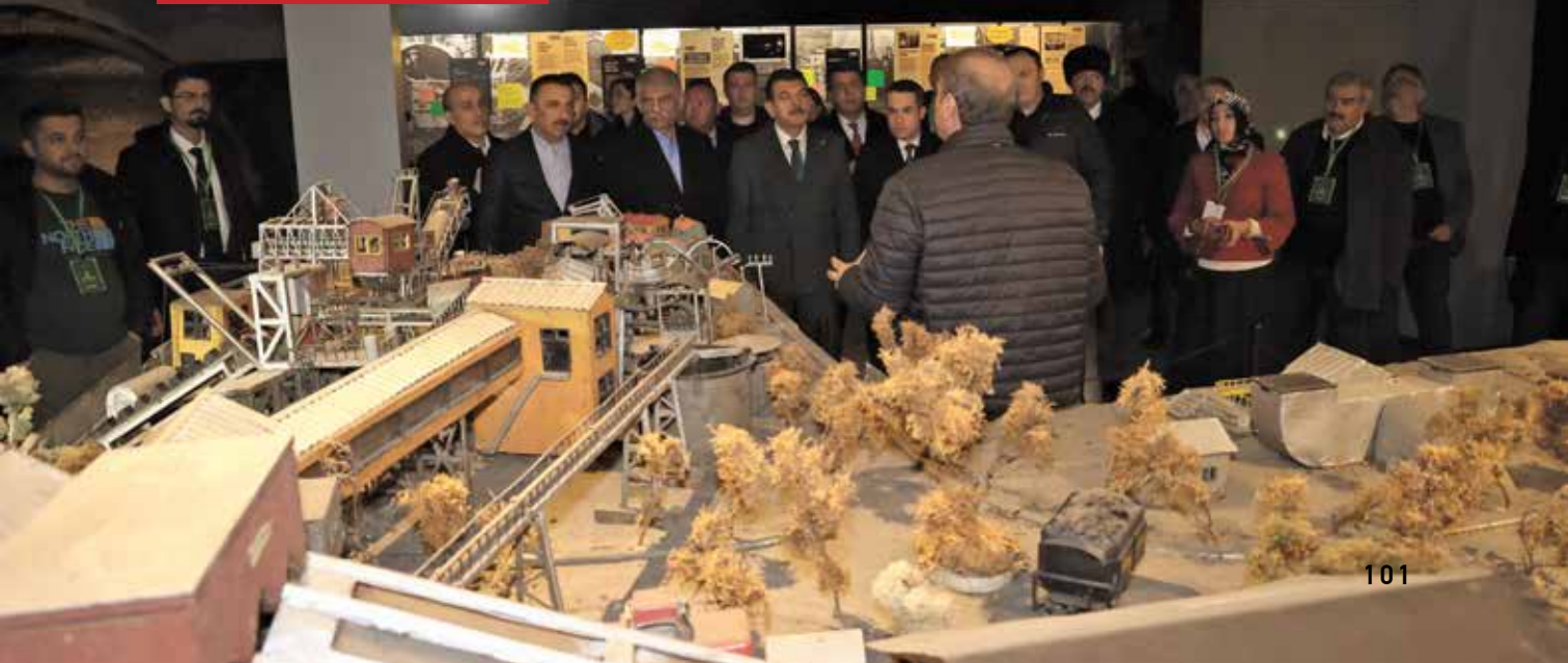
Zonguldak Maden Müzesi

Bugün Zonguldak, tarihsel mirasını koruyarak, kültürel ve ekonomik alanlarda öncü olmayı sürdüren bir şehir olarak varlığını devam ettirmektedir. Yer altı zenginlikleri, tarihî dokusu ve doğal güzellikleriyle, geçmişle gelecekle buluşturan bir şehir olmaya devam etmektedir.