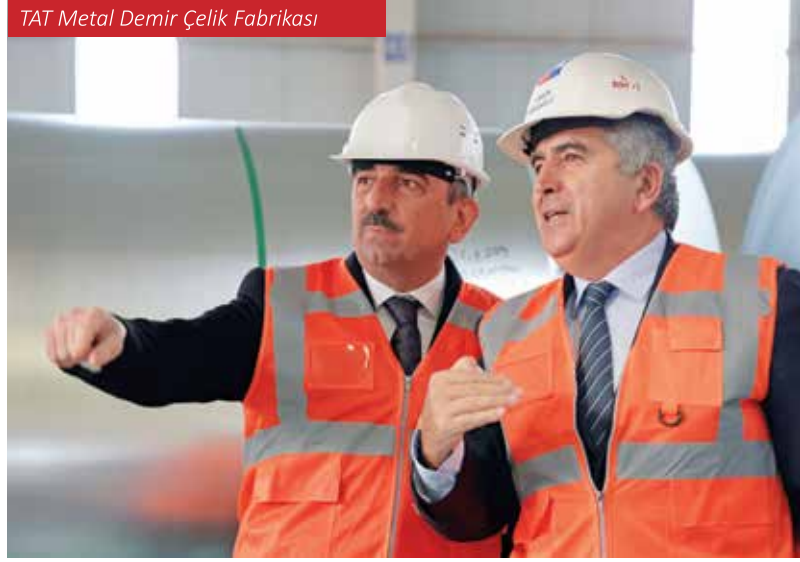
TAT Metal Demir Çelik Fabrikası

nızca uluslararası ticaretin merkezi olarak değil, enerji sektörü için de stratejik bir rol üstlenmektedir.