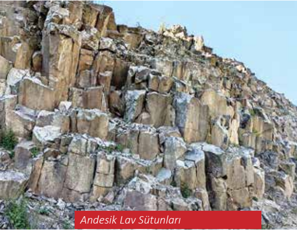
Andesik Lav Sütunları