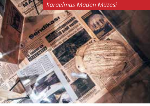
Karaelmas Maden Müzesi

karar, Zonguldak için tarihî bir dönüm noktasıdır. Zonguldak Kömür Jeoparkı, ülkemizdeki üç ulusal jeoparktan biri olarak tescil edilmiş ve Karadeniz kıyısındaki tek küresel aday olma unvanını kazanmıştır. Şu anda Uluslararası Jeopark statüsüne ulaşmak için çalışmalar devam etmektedir. Bu gelişme, Zonguldak'ın turizmdeki vizyonunu güçlendiren, doğal ve tarihî zenginliklerini sürdürülebilir bir yaklaşımla dünya çapında tanıtacak önemli bir adımdır.