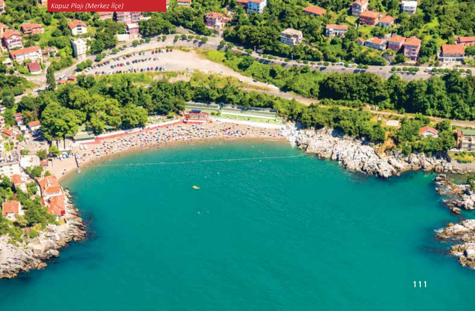
Kapuz Plajı (Merkez İlçe)