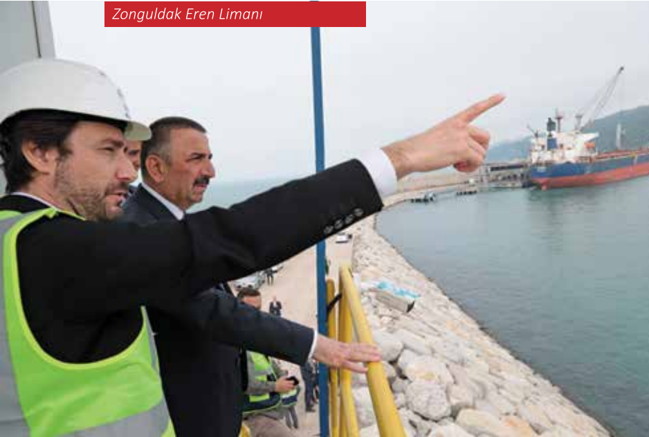
Zonguldak Eren Limanı

Son yıllarda Zonguldak ekonomisine yeni bir ivme kazandıran Filyos Limanı, Türkiye'nin en büyük üç limanından biri olarak öne çıkmaktadır. 25 milyon tonluk yük kapasitesiyle