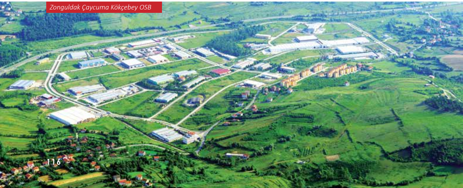
Zonguldak Çaycuma Kökçebey OSB

Sanayi alanında ise kömür madenciliğiyle başlayan bu serüven, bugün