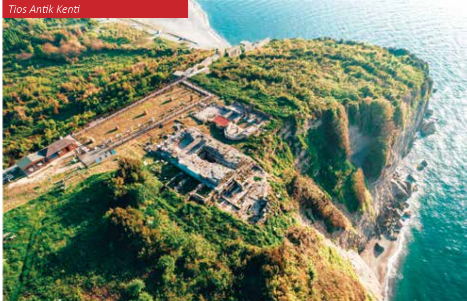
Tios Antik Kenti

olması, Roma İmparatorluğu döneminde burayı yalnızca ticaretle değil, kültürel etkileşimle de öne çıkan bir yer haline getirmiştir. Bugün bu antik kentteki kalıntılar, Zonguldak'ın tarihî önemini vurgulayan önemli birer miras olarak varlığını sürdürmektedir.