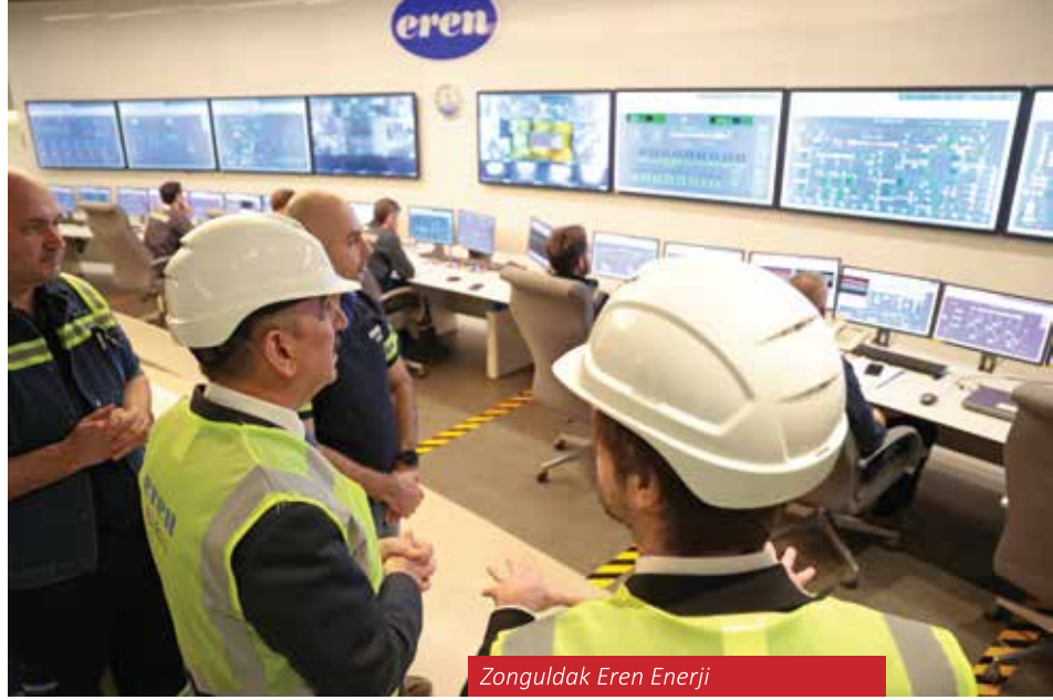
Zonguldak Eren Enerji

Zonguldak'ın 2053 vizyonu, geleneksel madencilik faaliyetlerinin yanı sıra yenilenebilir enerji, lojistik, sanayi, tarım ve turizm gibi sektörlerde sürdürülebilir bir kalkınma modeli oluşturmayı hedeflemektedir. Bu vizyonun merkezinde, Filyos Vadisi Projesi bulunmaktadır. Türkiye'nin en büyük lojistik ve sanayi projelerinden biri olan bu proje, Zonguldak'ı ulusal ve uluslararası