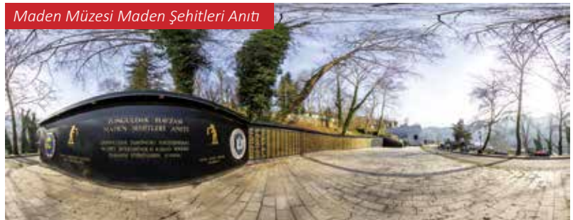
Maden Müzesi Maden Şehitleri Anıtı