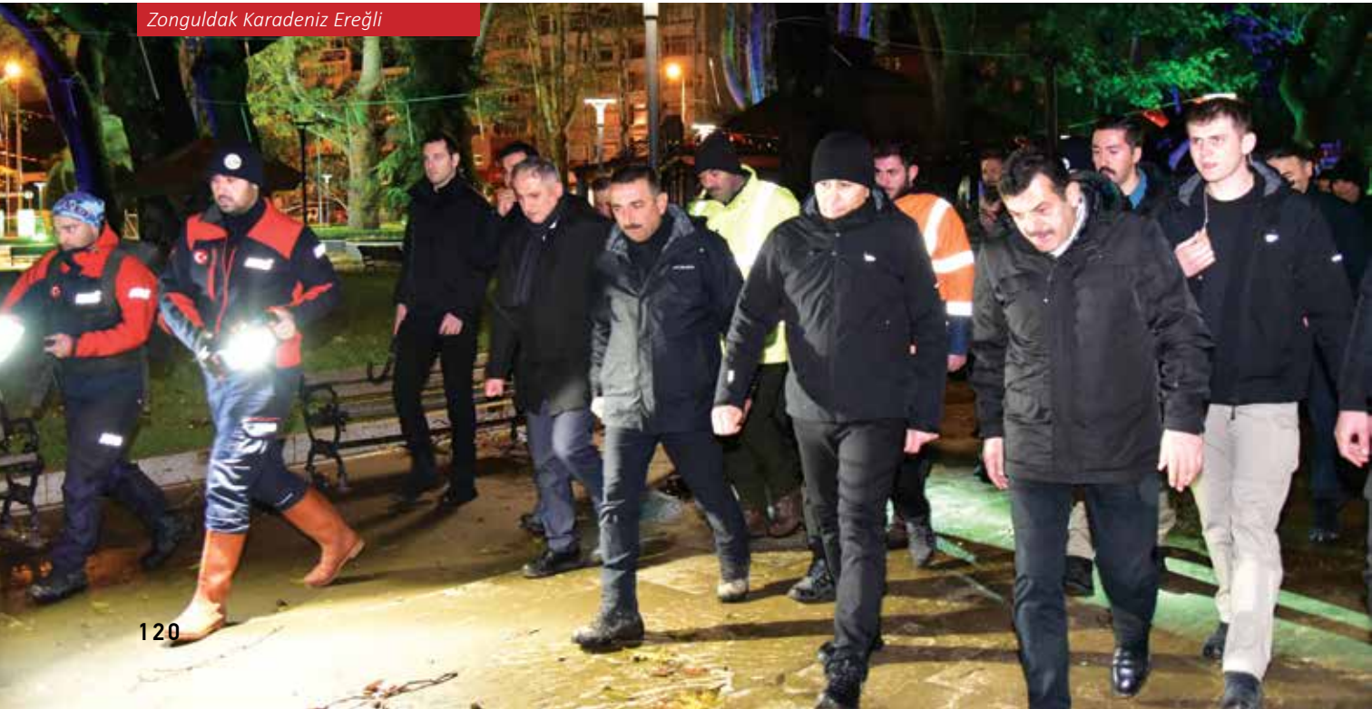
Zonguldak Karadeniz Ereğli

Afet yönetiminde, bireylerin bilgi ve beceri düzeyi, müdahale süreçlerinin etkinliğini doğrudan etkiler. Türkiye genelinde yürütülen afet farkındalık eğitimleri, toplumun her kesimini kapsayacak şekilde düzenlenmekte ve bireylerin afetlere karşı daha hazırlıklı hale gelmesini sağlamaktadır. Zonguldak'ta düzen-