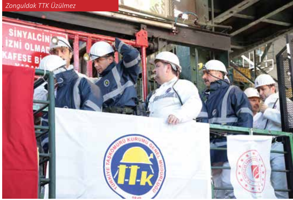
Zonguldak TTK Üzülmez

kaynağı olarak kullanılmış, böylece kömür ve çelik üretimi arasında güçlü bir bağ kurulmuştur.