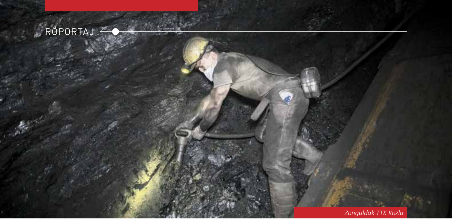
Zonguldak TTK Kozlu

Zonguldak ve taş kömürü neredeyse eş anlamlı kullanılmaktadır. Bu bağlamda madencilik sektörünün ile katkılarında bahsedebilir misiniz?