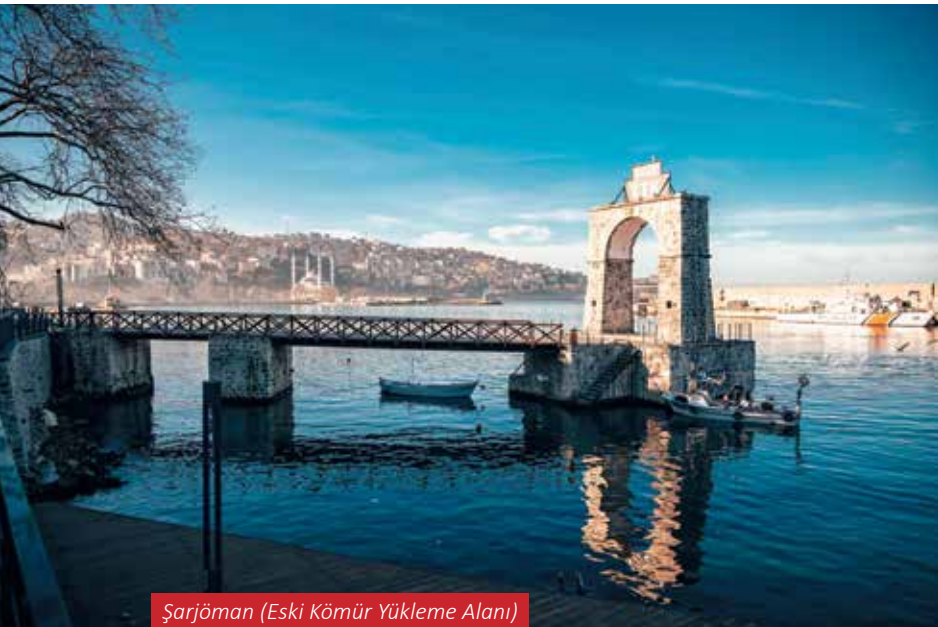
Şarjöman (Eski Kömür Yükleme Alanı)

Zonguldak, kömür madenciliğinden aldığı mirası koruyarak, günümüzde sanayi, tarım ve lojistik gibi alanlarda çeşitlenmeyi hedeflemektedir. Filyos Vadisi Projesi gibi büyük yatırımlar, Zonguldak'ı yalnızca bir madencilik merkezi olmaktan çıkarıp, enerji ve lojistik alanında bir merkez haline getirmektedir.