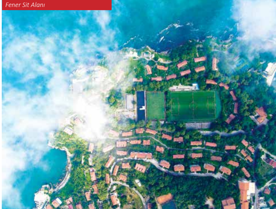
Fener Sit Alanı