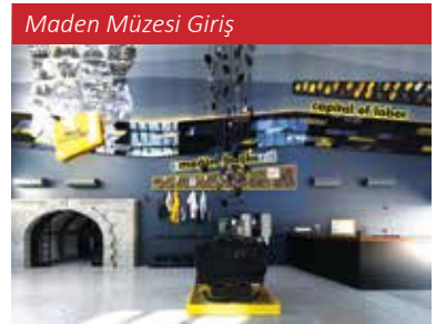
Maden Müzesi Giriş

Zonguldak, kömür ve kömür madenciliğine dayalı ekonomisine ilave olarak, mevcut doğal varlıklarını korumak ve turizm aracılığıyla bunları halkın gündelik yaşamına dahil etmek amacıyla önemli bir karar almıştır: "Zonguldak Kömür Jeoparkı." Bu karar, sanayi ile kültür ve doğa turizmini kaynaştırmak, şehrin ekonomisini ve sosyal yapısını zenginleştirmek için atılmış önemli bir adımdır.