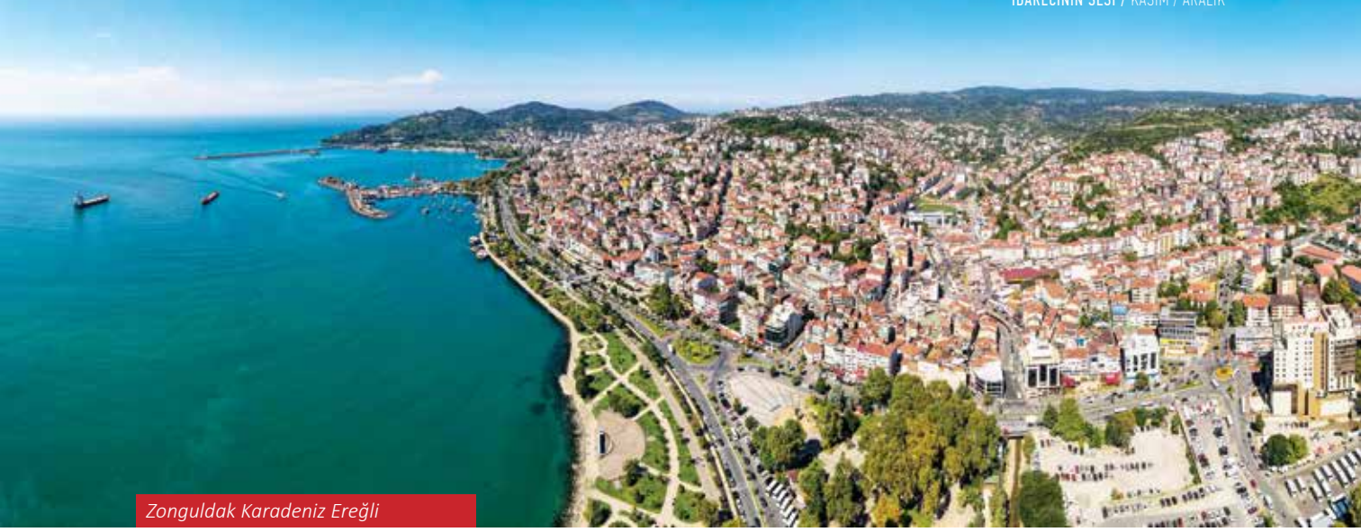
Zonguldak Karadeniz Ereğli

Bu şehri tanımlarken yalnızca taşkömüründen bahsetmek, Zonguldak'a haksızlık olur. Zonguldak, taşkömürünün keşfiyle birlikte bir sanayi merkezi haline gelmiş, Cumhuriyet'in ilk vilayeti olarak tarih sahnesindeki yerini almıştır. Ancak Zonguldak yalnızca sanayiyle anılmamalıdır; bu şehir, doğal güzellikleri ve turizm potansiyeliyle de dikkat çeker. Gökgöl Mağarası, Cehennemazğı Mağarası gibi jeolojik oluşumlar, Zonguldak'ın yer altındaki değerlerinin sadece madencilikle sınırlı olmadığını gösterir. Gökgöl Mağarası'nın sağlık turizmüne uygun iklimi özelliği, şehri farklı bir turizm odağı haline getirme potansiyeline sahiptir. Harmanmaya