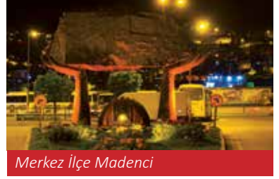
Merkez İlçe Madenci

Zonguldak, Karadeniz'in doğal ve bakir plajlarıyla kıyı turizminde de güçlü bir potansiyele sahiptir. Türkali, Göbü ve Filyos plajları, hem deniz tutkunları hem de sakin bir atmosfer arayanlar için ideal destinasyonlardır. Filyos kıyısındaki antik liman kalıntıları ise bölgenin tarihî ve do-