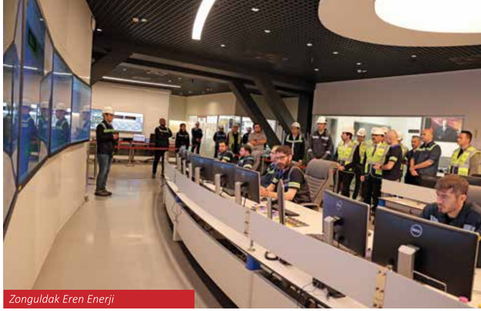
Zonguldak Eren Enerji

Zonguldak'ın madencilik tarihini ve jeolojik zenginliklerini koruyarak turizme kazandırmayı hedefleyen Zonguldak Kömür Jeoparkı, 23 Aralık 2023 tarihinde UNESCO Türkiye Milli Komisyonu tarafından Ulusal Jeopark olarak tescil edilmiştir. Karadeniz kıyısındaki tek ulusal jeopark olan Kömür Jeoparkı, Zonguldak'ın kültürel ve doğal mirasını uluslararası düzeyde tanıtmak için önemli bir adımdır. Jeopark, sanayi mirasını doğa turizmiyle birleştirerek Zonguldak'ı sürdürülebilir bir turizm destinasyonu haline getirmeyi amaçlamaktadır. Bu proje, şehrin ekonomik çeşitliliğine katkı sağlayarak, turizmde önemli bir potansiyel yaratmaktadır.