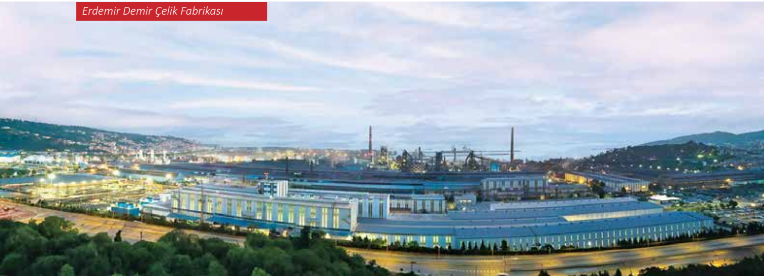
Erdemir Demir Çelik Fabrikası

yük lojistik ve sanayi projelerinden biri olarak kabul edilen bu proje, bölgeyi enerji, teknoloji ve sanayi üretiminin merkezi haline getirme-