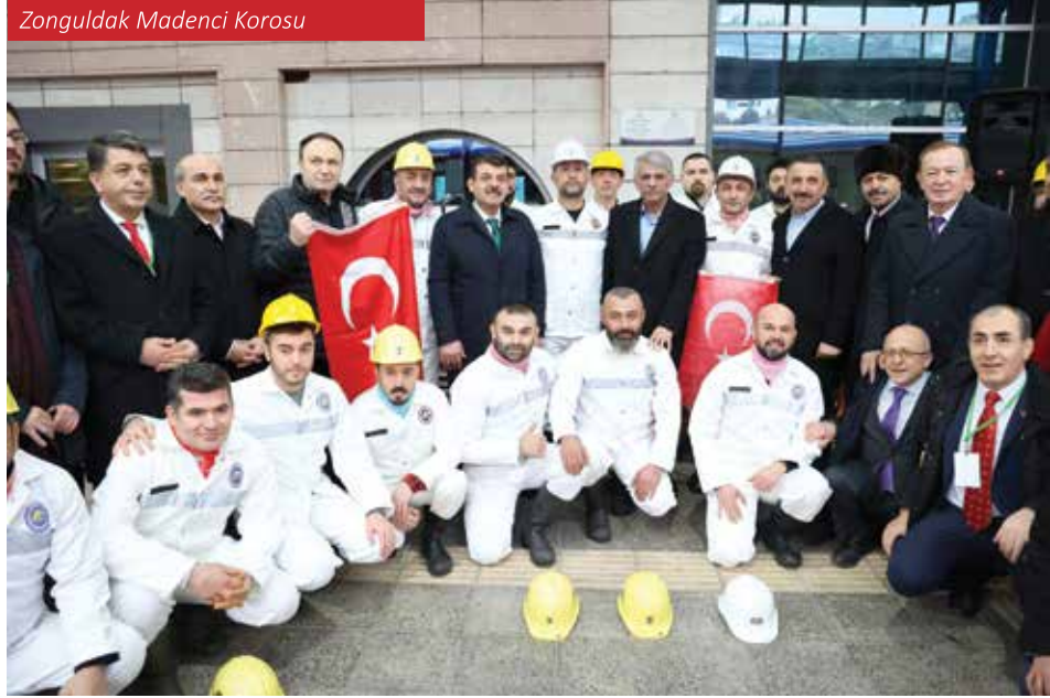
Zonguldak Madenci Korosu

ye'de maden mühendisliği eğitimi- nin başladığı ilk şehir olma özelliği taşıır. Daha sonra 1992 yılında Bülent Ecevit Üniversitesi'nin kurul-