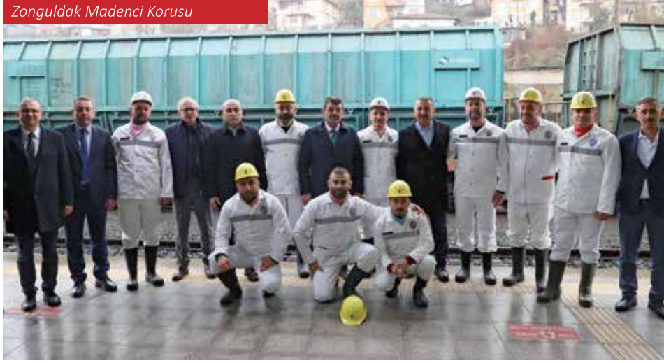
Zonguldak Madenci Korusu

Ereğli Demir ve Çelik Fabrikaları (ERDEMİR), Zonguldak'ın sanayi kimliğinin en önemli temsilcilerinden biridir. 1965 yılında Karadeniz Ereğli'de kurulan ERDEMİR, Türkiye'nin en büyük demir-çelik üreticilerinden biri olarak, şehir ekonomisinin temel taşlarından biridir. Demir-çelik sanayisi, hem istihdam hem de ihracat açısından Zonguldak'ın sanayideki liderliğini korumasını sağlamaktadır.