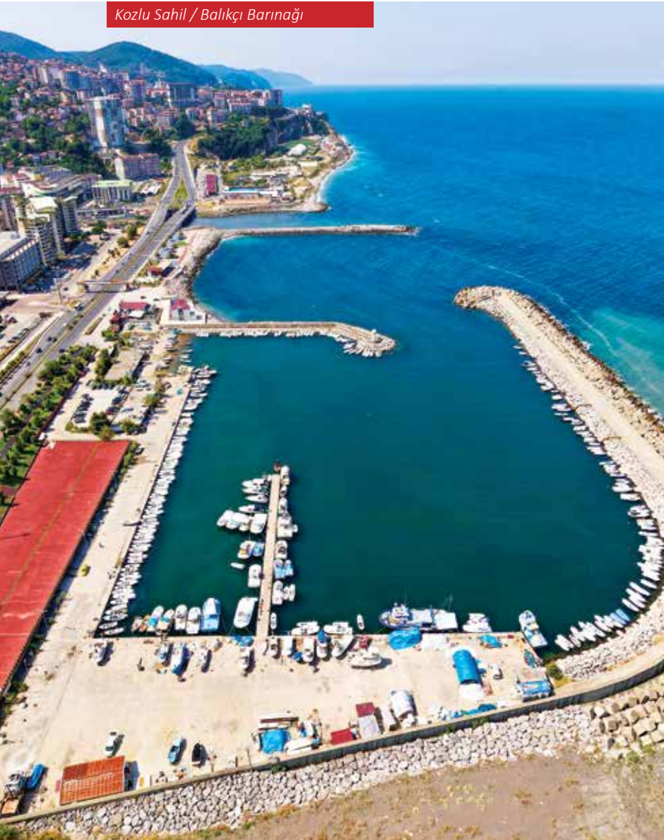
Kozlu Sahil / Balıkçı Barınağı

Zonguldak'ın limanları, tarih boyunca şehrin ekonomik kimliğini belirleyen en önemli unsurlardan biri olmuştur. Bugün Filyos Limanı'nın devreye girmesiyle bu rol daha da genişlemiş, Zonguldak yalnızca bölgesel bir merkez olmanın ötesine geçerek, uluslararası ticaret ve enerji sektörünün önemli bir aktörü haline gelmiştir. Limanlar, Zonguldak'ın tarihî mirasını koruyarak geleceğe taşınmasında, sanayi ve lojistiğin sürdürülebilir bir şekilde gelişmesinde hayati bir yere sahiptir. Bu limanlar, Zonguldak'ın geçmişte olduğu gibi gelecekte de Türkiye'nin kalkınmasında öncü bir şehir olmasını sağlayacaktır.