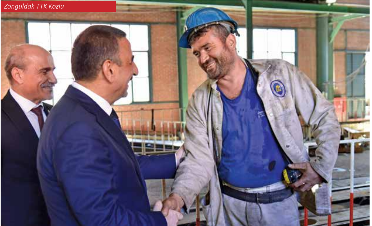
Zonguldak TTK Kozlu

kez olmasını sağlamıştır. 1924 yılında Cumhuriyet'in ilanından hemen sonra, madencilik sektörüne nitelikli iş gücü sağlamak amacıyla Maden Mühendisliği eğitimi başlatılmıştır. Bu bağlamda, Zonguldak, Türki-