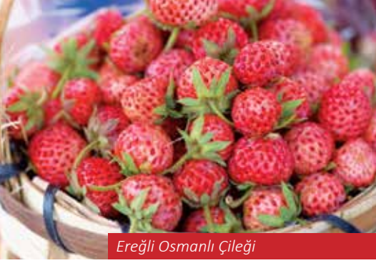
Ereğli Osmanlı Çileği