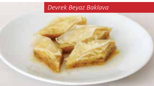
Devrek Beyaz Baklava