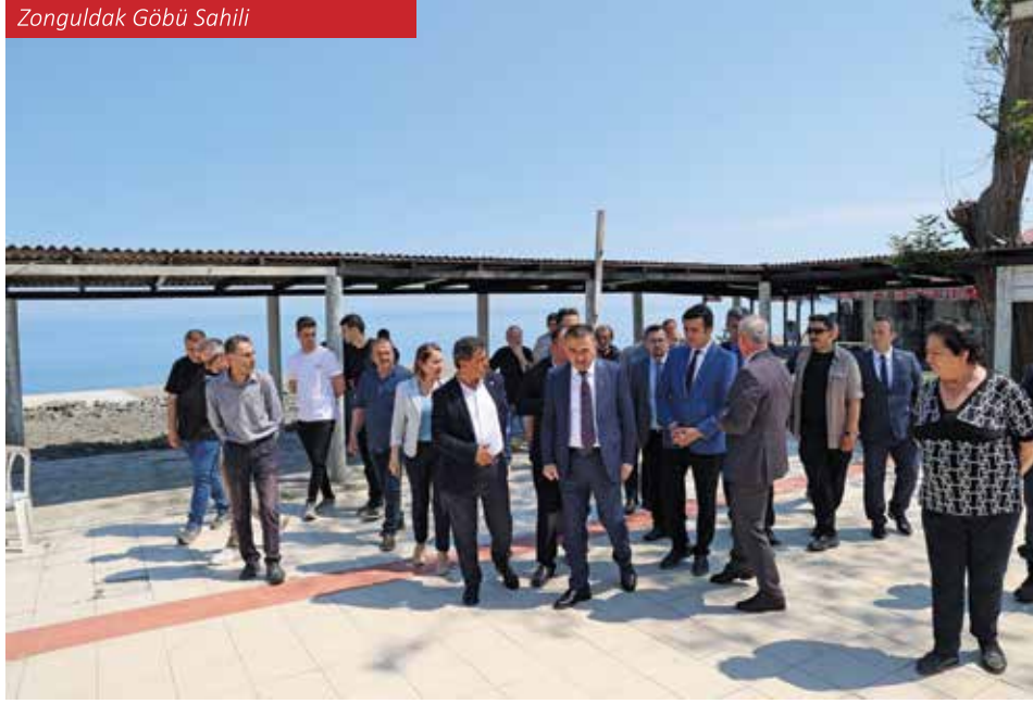
Zonguldak Göbü Sahili

Zonguldak Limanı, kömür taşımacılığında yüzyılı aşkın süredir önemli bir rol oynamaktadır. Osmanlı döneminden itibaren taşkömürünün çıkarılıp gemilerle diğer bölgelere taşınmasında bu liman kritik bir merkez olmuştur. Cumhuriyet döneminde ise Zonguldak Limanı, maden taşımacılığının yanı sıra sanayi ve ticaret faaliyetlerini de