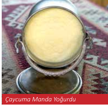
Çaycuma Manda Yoğurdu