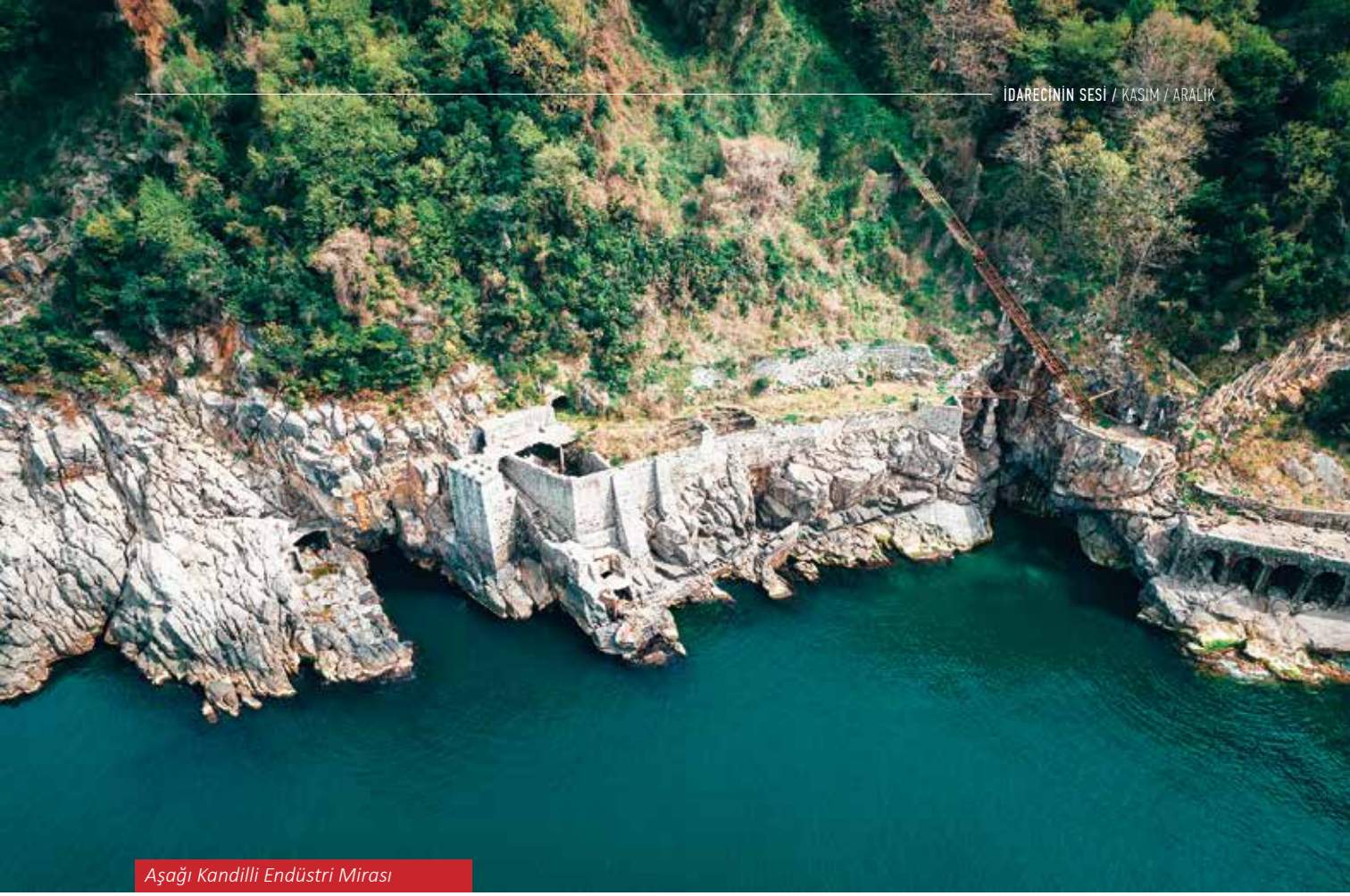
Aşağı Kandilli Endüstri Mirası

Zonguldak'ın kültür ve turizm potansiyeli ve bu kapsamda öne çıkan değerlerini anlatabilir misiniz?