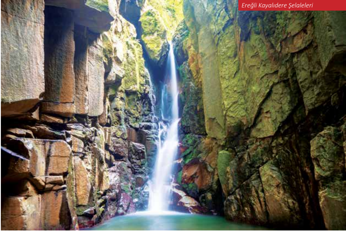
Ereğli Kyalıdere Şelaleleri

nemağzi Mağarası ve Harmankaya Şelaleleri gibi doğal alanlar, ziyaretçilere doğanın büyüleyici atmosferinde bir deneyim sunmaktadır. Gümeli Tabiat Anıtı'nda bulunan 4117 yaşındaki porsuk ağacı, dünyanın en