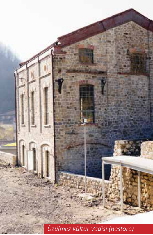
Üzülmöz Kültür Vadisi (Restore)