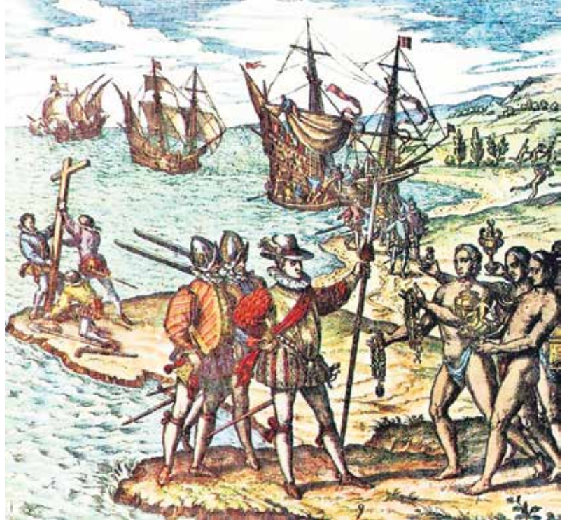
Fotoğraf 4. Kristof Kolomb Haiti'de yerlilerden hediye alırken

denizlere açılmaya cesaret geldi. Gemi sanayi gelişerek okyanus dalgalarına dayanıklı karavel ve kalyonların yapılması, denizci saatleri, kronometre ve deniz araçlarıyla enlem-boylam hesaplarının gelişmesi, termometre, barometre, teleskop, mikroskop gibi icatları yanında daha birçok icatların olması, samanyolu-gezegenler ve güneş sisteminin izlenmesi, trigonometri hesapları yapılabilmesi, fizik ve kimya sahasında ilerleme yanında hekimliğin gelişmesi, coğrafya ve doğa tarihi kitapları ile bilgi artması, dünyanın yuvarlak olduğu fikrinin ortaya atılması gibi buluş ve icatlar gemiciliğin gelişmesini sağlayan etkenler oldu.