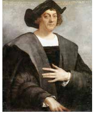
Fotoğraf 3. Kristof Kolomb ( https://www.britannica.com/summary/Christopher-Columbus-Achievements )

Strobon yazdığı “coğrafya” adlı yapıtta enlem-boylamdan söz ederek, dünya dönenceler ve Atlas Okyanusu ile Çin arasındaki bölgelerden oluştuğunu göstermekteydi.