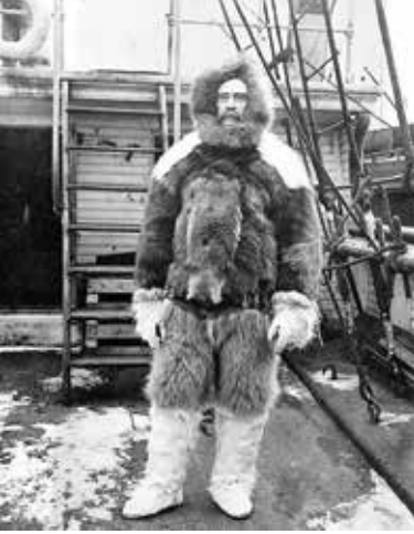
Fotoğraf 1. Kuzey Kutbuna varan ilk insan, Robert Edwin Peary ( https://www.britannica.com/biography/Robert-Edwin-Peary )