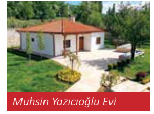
Muhsin Yazıcıoğlu Evi