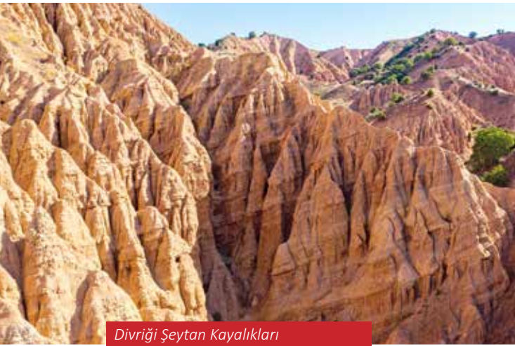
Divriği Şeytan Kayalıkları