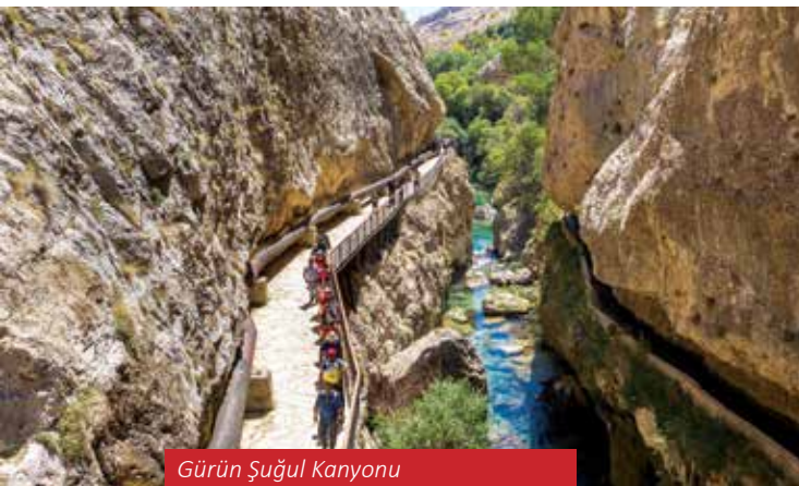
Gürün Şuğul Kanyonu

magnezyum, sodyum karbonat ve klorür bileşenleri bulunmaktadır. Sıcak Çermik termal suyunun romatizmal hastalıklar, kemik ve kireçleme hastalıkları, deri hastalıkları, kadın hastalıkları, böbrek ve idrar yolları rahatsızlıklarında yararlı olduğu bilinmektedir. Limonit ve hematit içerikleri ile etkileyici bir görüntü oluşturan Altınkale travertenleri de kaplıcanın en önemli jeolojik zenginliğidir.