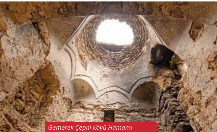
Gemerek Çepni Köyü Hamamı