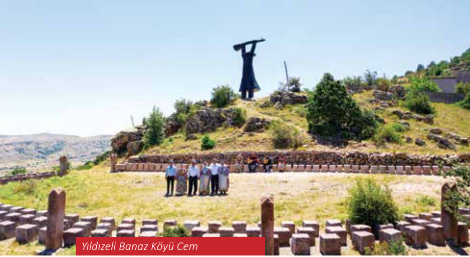
Yıldızeli Banaz Köyü Cem

güne ekonomik kalkınma süreci de hızlanmaya başlamıştır. 1. Organize Sanayi Bölgesi (OSB) %100 doluluk oranı ve yaklaşık 10 bin kişi ile üretime ve istihdama katkı sağlarken, cazibe merkezi Demirağ Organize Sanayi Bölgesi'nde ise % 85 doluluk oranına ulaşılmıştır. Demirağ OSB'de nihai hedef ise 40 bin kişinin istihdam edilmesidir.