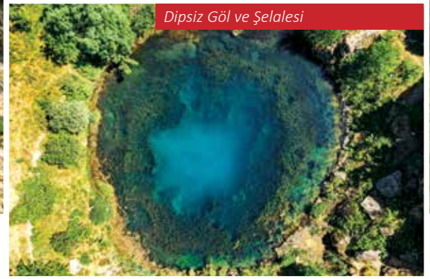
Dipsiz Göl ve Şelalesi