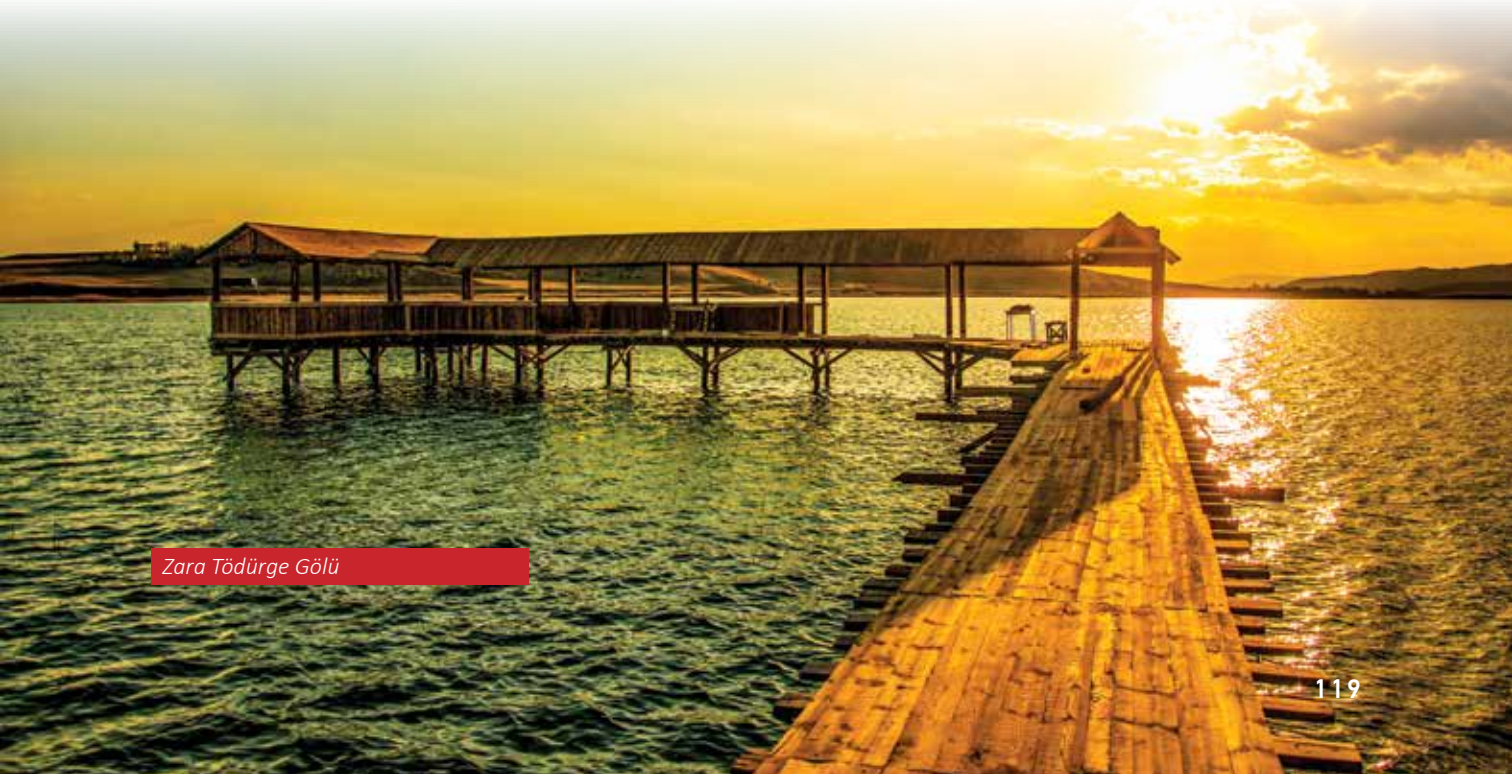
Zara Tödürge Gölü