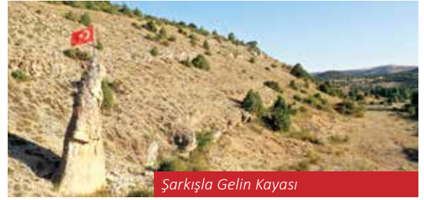
Şarkışla Gelin Kayası

midye Abdülhamit Han Anı Evi de gezilip görülebilecek diğer kültürel mekânlardandır.