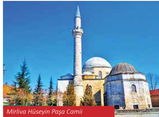
Mirliva Hüseyin Paşa Camii

Tarihi İncecik Erenler Hamamı'na 1. Murat ve Yıldırım Beyazıt devri vezirlerinden Saruca Paşa'nın oğlu Uğur Bey Vakfı kayıtlarında rastlanmakta olup, 16. yüzyılın ilk yarısında inşa edilmiştir. İncecik Erenler Hama-