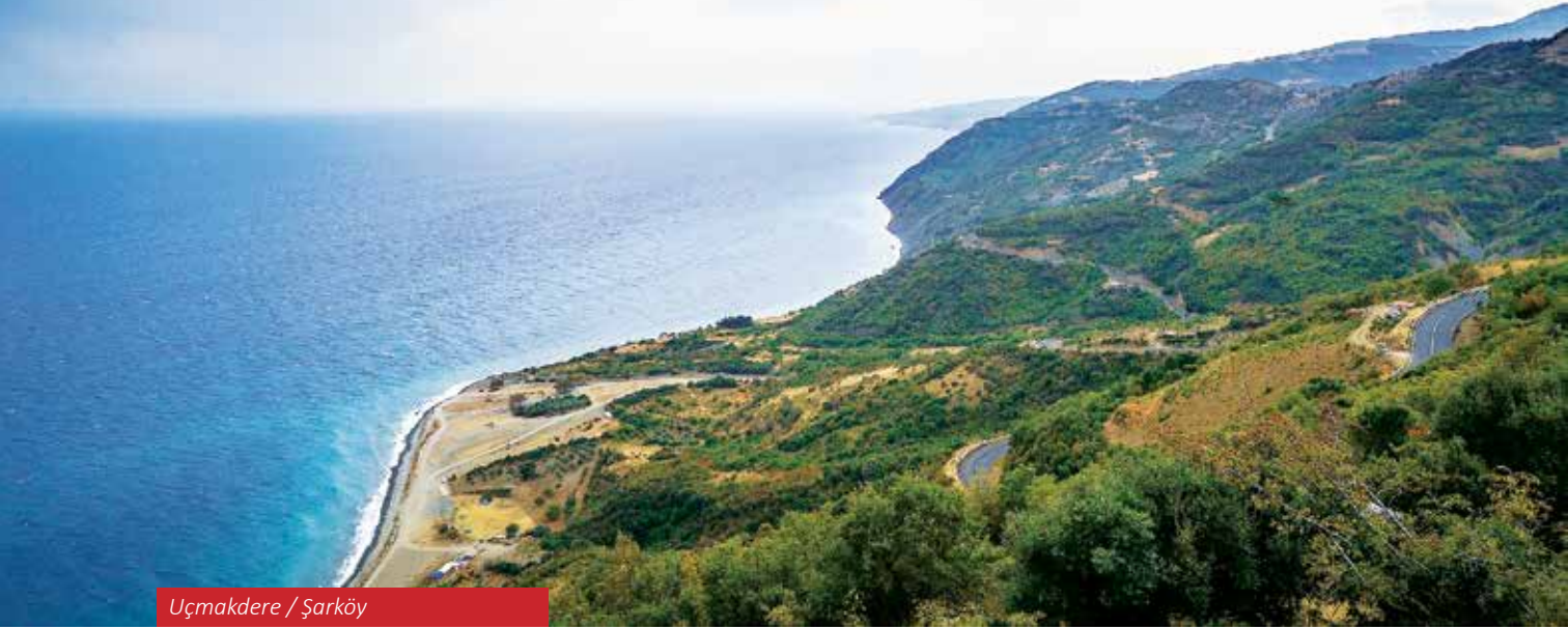
Uçmakdere / Şarköy

Yeniköy'den 625 m. rakımlı Nişantepe'ye çıkış yolunu açması ve Ayvasıl Mevki'ndeki deniz kıyısını iniş alanı olarak düzenlemesi ile birlikte, Yeniköy- Uçmakdere bölgesi yamaç paraşüt sporcularının kullanımına açılmıştır. İstanbul'a olan yakınlığı sayesinde çok sayıda ziyaretçiyi ağırlayan Uçmakdere, Ganos Dağları'nın yeşili ve Marmara Denizi'nin mavisi eşliğinde ziyaretçilerine yamaç paraşütüyle gökyüzü ile buluşmanın keyfini yaşatmaktadır.