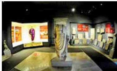
Arkeoloji ve Etnografya Müzesi

Kültür ve Turizm İl Müdürlüğümüz ve Trakya Kalkınma Ajansı tarafından 2018 yılında imzalanan protokol doğrultusunda Karacakılavuz Dimi Dokuması'na coğrafi işaret almak üzere çalışmalara başlanmıştır. Sürdürülen çalışmalar sonucunda "Malkara Eski Kaşar Peyniri"nden sonra 2. Coğrafi İşareti alan ürünümüz "Karacakılavuz Dimi Dokuması" olmuştur.