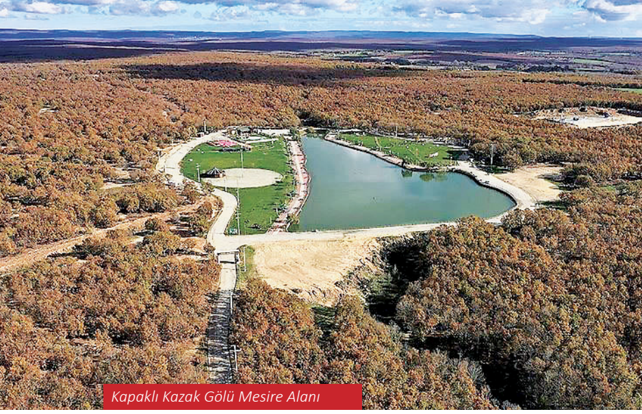
Kapaklı Kazak Gölü Mesire Alanı