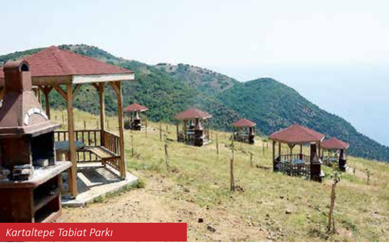
Kartaltepe Tabiat Parkı

hüküm sürdüğü Mürefte'de, ılıman iklim koşullarından ötürü genellikle zeytin üretimi ve üzüm üretimi gerçekleştirilmektedir.