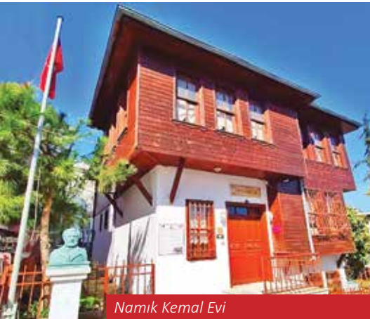
Namık Kemal Evi

Vatan şairi olarak anılan Namık Kemal, 1840 yılında Tekirdağ'da dünyaya gelmiştir. Doğduğu evin bulunduğu çevredeki eski Türk evleri örnek alınarak 1993 yılında yaptırılan Namık Kemal Evi müze olarak hizmet vermektedir. Ziyaretçilere Tekirdağ'ın geçmişinden ve şairin hayatından izler sunan müzede Mustafa Kemal Atatürk ve Çanakkale Savaşları'nın kazanılmasında önemli rolü olan ve Mustafa Kemal