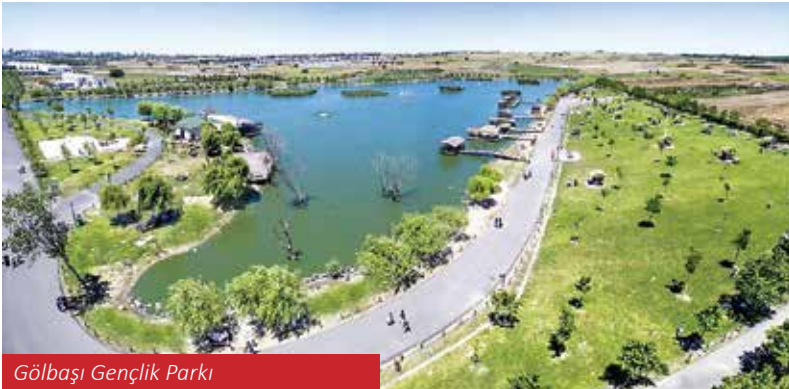
Gölbaşı Gençlik Parkı

Güzergah uzunluğu, 13 km, zorluk derecesi orta zor (toprak yol-patika) olan parkur, yürüyüş sırasında panoramik manzara, deniz, orman, üzüm bağları gibi doğal güzellikleri görme imkanı sunuyor. Parkur sonbahar, yaz, ilkbahar, kış olmak üzere yılın her mevsimi yürümek için uygundur.