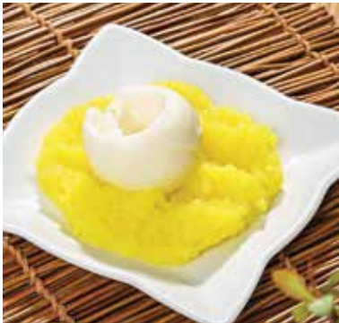
Tekirdağ Peynir Helvası

Tekirdağ köftesinin lezzetinin altında etin kalitesinden seçimine, hazırlanmasından pişirilmesine kadar takip edilen titiz süreç yatmaktadır. Köftenin kendine has yumuşak ve elastiki bir yapısı vardır. Servis edilirken yanına genellikle piyaz, acı sos ve ızgara edilmiş yeşil sivri biber konulur.