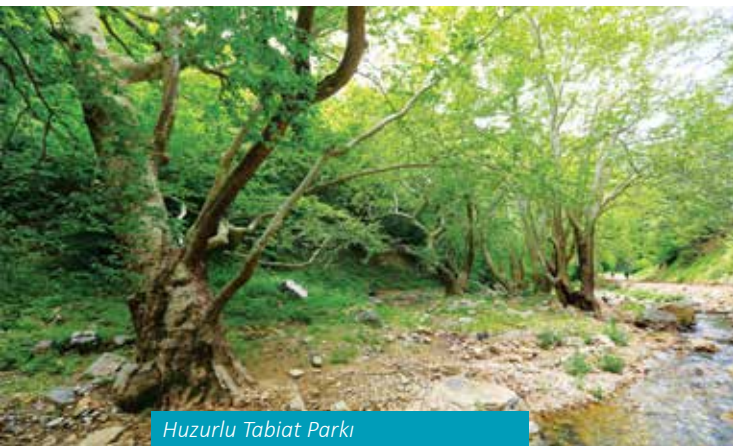
Huzurlu Tabiat Parkı

Karkamış Taşkın Ovası Sulak Alanı göçmen kuşların göç yolu üzerindedir. 2016 yılında Sulak Alan Yönetim Planı Ulusal sulak Alan Komisyonunca onaylanmıştır. Alanın sembolü Fırat kaplumbağası ve kelaynaktır.