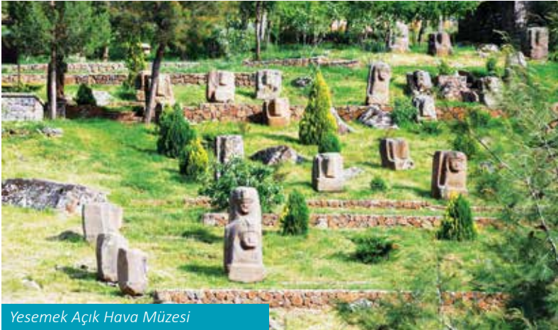
Yesemek Açık Hava Müzesi

yakın doğunun en büyük taş ocağı ve heykel işleme atölyesiydi. Yerli halk Hurrilerin çalıştığı atölye, bölgenin Hitit hakimiyeti altına girdiği, M.Ö. 1375-1335 yılları arasında, İmparator 1. Şuppiluma zamanında işletmeye açılmıştır. Yaklaşık 300'ün üzerindeki yontu taslağının toprak altından çıkarılıp belli bir düzende sergilendiği Açık Hava Müzesi'nde taslakların büyük çoğunluğunu kapı aslanları oluşturmaktadır.