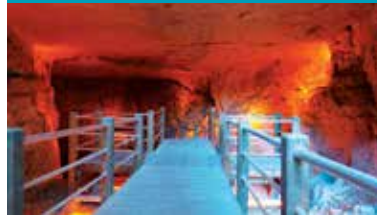
Dülük Antik Kenti

Dülük, "Antik Kent" ve "Kutsal Alan" olmak üzere ikiye ayrılmaktadır. Dülük Mitras Tapınağı, Gaziantep Müzesi ile Almanya Münster Üniversitesi'nin katılımlı kazıları sonucunda 1997-1998 yıllarında ortaya çıkarılmıştır. Anadolu'da bulunan Mitras Yeraltı Tapınağı'nın ilkidir.