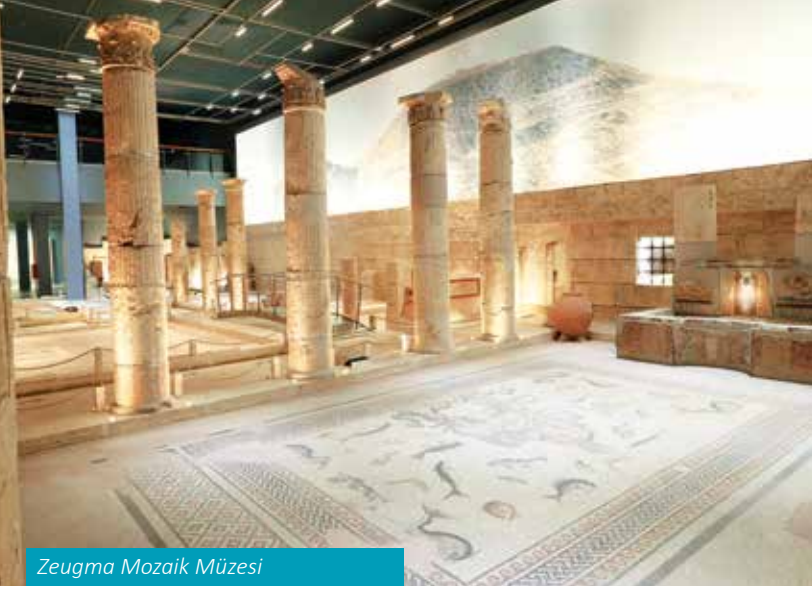
Zeugma Mozaik Müzesi

zesi'nde Alt Paleolitik dönemden Cumhuriyet dönemine kadar olan sergileme üniteleriyle ziyaretçileri adeta geçmişten günümüze tarihsel bir yolculuğa çıkarmaktadır.