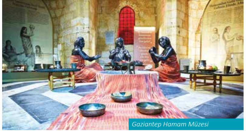
Gaziantep Hamam Müzesi

Gaziantep Kalesi'nin yanı başında yer alan, Osmanlı hamam mimarisini ve kültürünün en güzel örneklerinden birisi olan yapı, Lala Mustafa Paşa tarafından yaptırılan külliye'nin yüzyıllarca hamam bölümü olarak