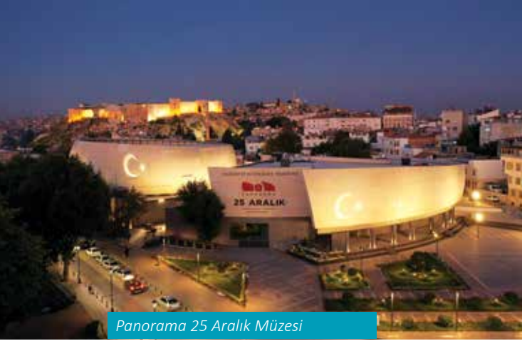
Panorama 25 Aralık Müzesi