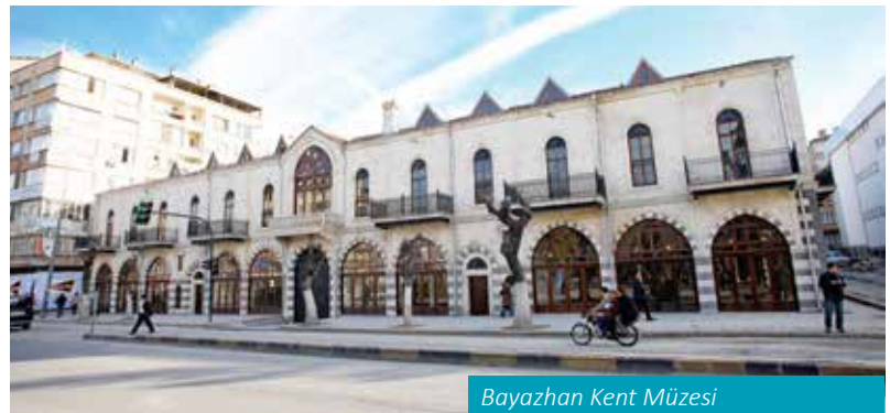
Bayazhan Kent Müzesi