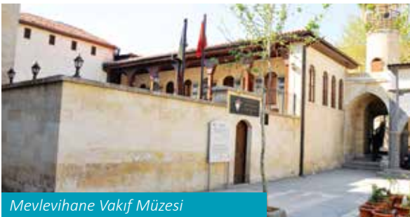
Mevlevihane Vakıf Müzesi

Mevlevihane olarak inşa edilen, 4 asırlık tarih bina, çok sayıda vakıf eserinin sergilendiği Gaziantep Mevlevihanesi Vakıf Müzesi olarak tanzim edilmiştir. Mevlevilik Kültürü ile Vakıf Kültür Varlıklarından seçilen Maden Eserleri, El Yazması