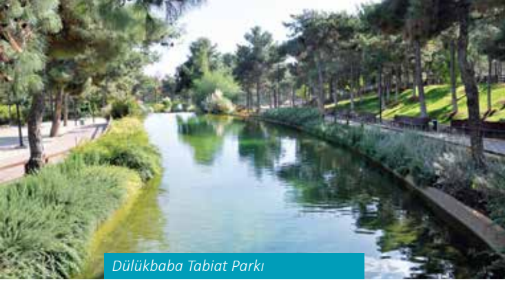
Dülükbaba Tabiat Parkı

Hayatı Koruma alanıdır. Hayvanat bahçesi yaklaşık 325 tür ve 7.100 canlıyla sadece Gaziantep'e değil tüm bölgeye ve Türkiye'ye hizmet vermektedir.