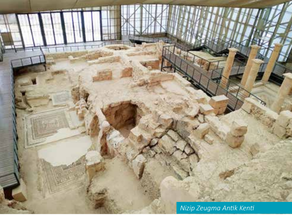
Nizip Zeugma Antik Kenti