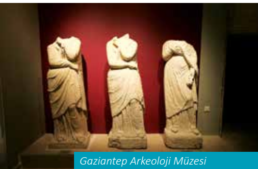
Gaziantep Arkeoloji Müzesi