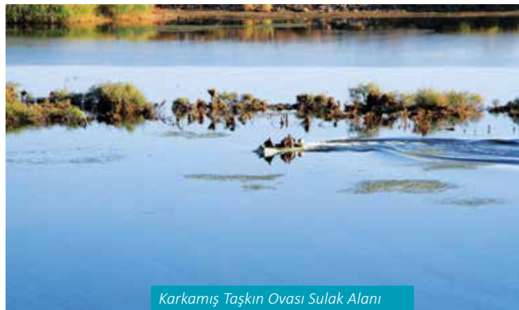
Karkamış Taşkın Ovası Sulak Alanı