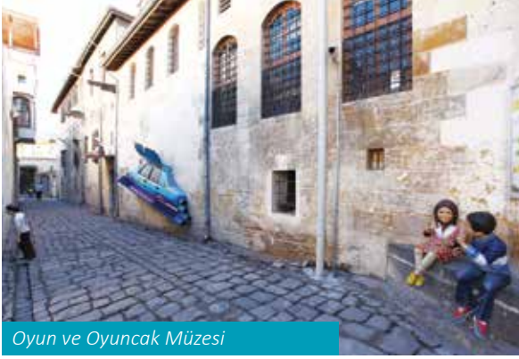
Oyun ve Oyuncak Müzesi