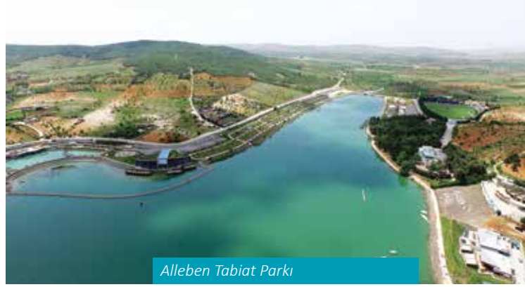
Alleben Tabiat Parkı

Huzurlu Yaylası, Akdeniz fitocoğrafya bölgesinde yer alan Amanos Dağlarının en güney noktasında yer almaktadır. Önemli bir yayla turizmi potansiyeline sahiptir.