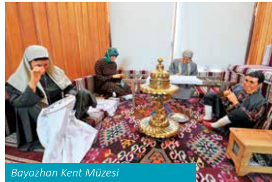
Bayazhan Kent Müzesi

Gaziantep'te bulunan Türkiye'nin ilk Turizm Bakanı Ali İhsan Göğüş'ün Gaziantep şehrine bağışladığı kütüphanesi ile özel eşyalarının sergilendiği bir müzedir. 2. katı Gaziantep Araştırmaları Merkezi olarak hizmet vermektedir. Müzenin 3. katında Antep Evleri manzaralı bir kafede kahve keyfi yapmak mümkündür.