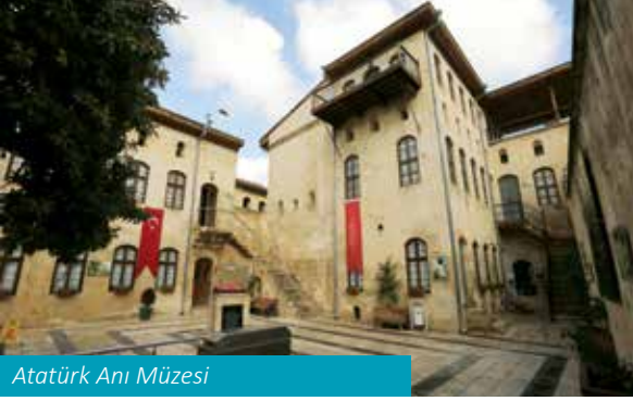
Atatürk Anı Müzesi