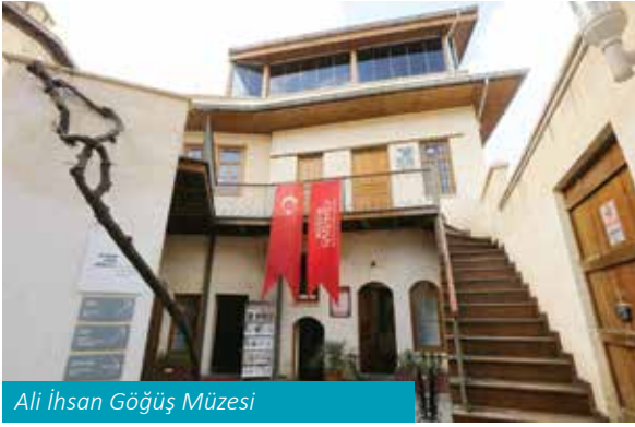
Ali İhsan Göğüş Müzesi