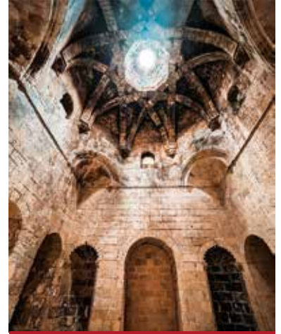
Mor Kiryakos Manastırı

Batman merkeze yaklaşık 12 km. mesafede olup, Beşiri İlçesi'ndeki Kıra Dağı'nın Kuzey Mezopotamya ovasına bakan doğu yamacında, Ayrancı Köyü'nde bulunmaktadır.