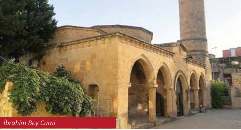
İbrahim Bey Cami

almaktadır. İlçenin en büyük ve en eski camisi olan tarihi yapının iç mekanındaki giriş kısmında yer alan kitabesine göre 890/1485 tarihinde Osmanlı Dönemi'nde Hazo ve Sason Beyi Ebubekir Rojiki'nin oğlu Hıdır Bey tarafından inşasına emir verildiği belirtilmektedir. Hıdır Bey Cami, kuzey-güney doğrultusunda dikdörtgen bir alana sahip olup, oldukça meyilli bir alana inşa edilmiştir. Yapı plan açısından camiden ziyade başka bir yapı (teke-zaviye, imaret) tipinin planına benzemektedir. Yapının kuzey ve kuzeydoğu kısmında bir türbe kalıntısı ve tarihi niteliğe sahip 15-20. yy arası tarihlendirilen mezar taşlarının dikkatini çekmektedir.