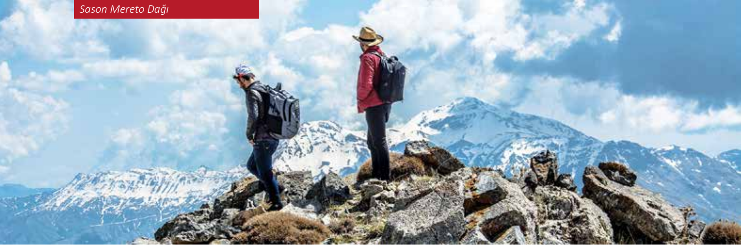
Sason Mereto Dağı

İlca önemli eser ise şunlardır: Yıldızlı Şeyh Bace / Anuşirvan Kalesi, Rabat Kalesi, Kandil Kalesi, Çayhan Köprüsü ve Aliçlı köyü tarihi mezarlık alanındaki figürlü mezar taşlarıdır.