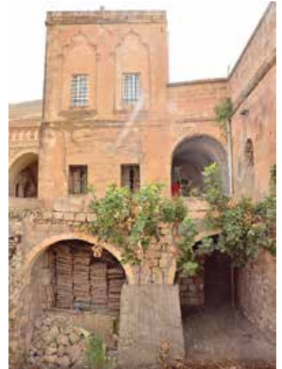
Gercüş Bedrettin Ağa Konağı

Gercüş'ün köylerinde bulunan önemli nitelik ve nicelikte tarihi kiliseler, manastırlar, kayaya oyma konutlar, kaya mezarları, sarnıç-ışlık alanları ve yöresel taş konak/evler görülmeye değerdir.