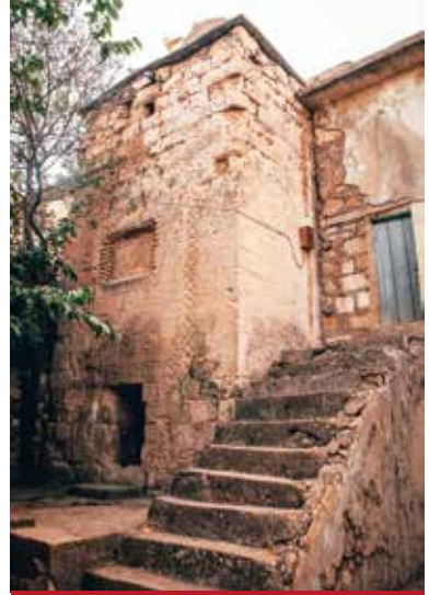
Hıdır Bey Camii

Orta Çağ'ın yöredeki en önemli yerleşim yerlerinden olan ve 13-15 yy. arasında Dilmaçoğlu Beyliği'ne başkentlik yaptığı belirtilen tarihi