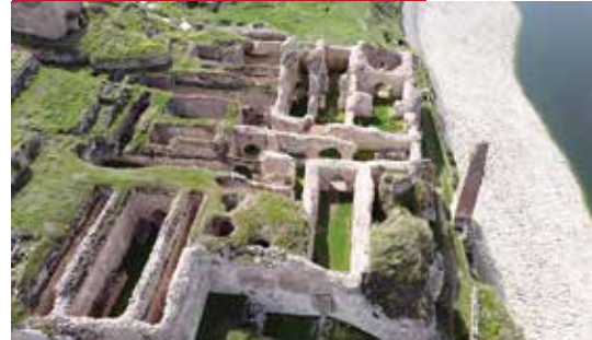
Hasankeyf Büyük Saray

Yapı İç Kale'de, Dicle Nehri ve Vadisine nazır bir konumda (günümüzde Ilisu Baraj Gölü'ne) kalenin en hâkim noktası olan üst kısımda, bulunmaktadır. Bulunduğu nokta-