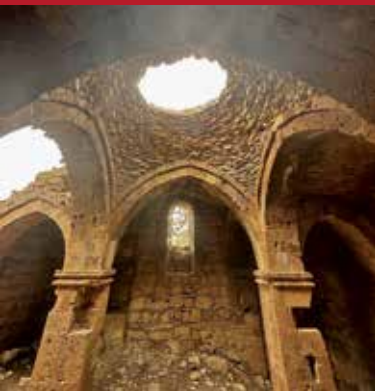
Sason Komk Manastırı

bilinenden daha da geçmişe giderek onlarca kültür varlığımız tespit edilerek kayıt altına alınmıştır.