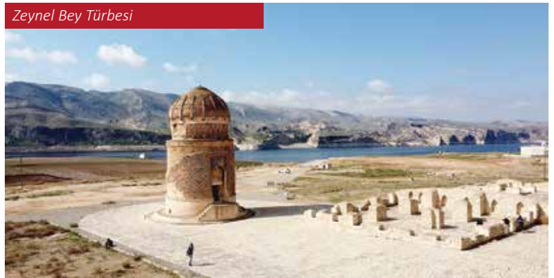
Zeynel Bey Türbesi

Şehirleşme bakımından oldukça yeni olarak bilinen Batman'ın aslında kent/yerleşim geçmişinin günümüze gelebilen farklı kültürlerin eserlerinden anlaşıldığı üzere insanoğlunun Anadolu ve Mezopotamya topraklarında var olduğundan buyana kesintisiz bir şekilde devam ettiğinin en güzel örneği Hasan-