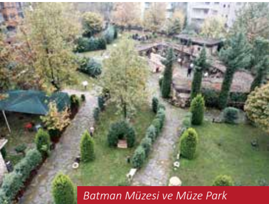
Batman Müzesi ve Müze Park

Müzedede, Paleolitik-Neolitik, İlisu ve Hasankeyf Salonu olmak üzere 3 sergi salonu bulunmaktadır. Teşhir Salonundaki Ünik Eserler Başur höyük'te ele geçen Oyun Taşları, metal eserler ve diğer eserlerdir. Batman Müzesi görme engelli ziyaretçiler için oluşturulan uygulamalar ile en-