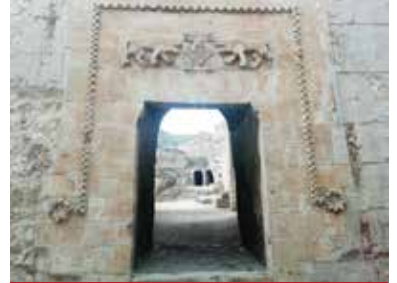
Hasankeyf Küçük Saray

Hasankeyf Örenyeri'nde yüzlerce mağara olarak adlandırılan kayaya oyma konut-mescit-kilise vb. yapılar, tarihi çarşı sokak kalıntıları ve su tünellerinin yanı sıra anıtsal boyuttaki mimari yapılardan; Yamaç Külliyesi, İç Kalede Küçük Saray, Büyük Saray, Ulu Cami gibi yapılar başlıcalarıdır.