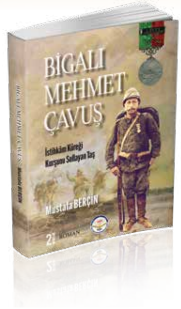
Berçin, M. (2023) Bigalı Mehmet Çavuş , 2. Baskı, Ankara: TİAV

Bütün takım saniyeler içinde emri yerine getirdi. Mehmet Çavuş siperde yanında bulunan istihkâm küreğini kavradı. Küreğin sapı nerdeyse sıkılmaktan kırılacaktı. Sırtını dayadığı kayanın arkasından elinde istihkâm küreğiyle fırlaması bir oldu. İngilizler şaşkın. Ateş etmeyi bile unuttular bir an. O bir saniyelik zaman Mehmet Çavuşa yeterliydi. Önüne çıkan ilk İngiliz'in kafasına o kadar şiddetle, öfkeyle vurdu ki küreği, çıkan tok ses bütün sesleri bastırdı. Bu arada "Allah, Allah." nidalarıyla bütün takım süğü hücumuna katılmıştı. Artık silah sesinden çok süğülerin sesi, delinen bağırarlar, hırıltılar, boğuşmalar, kan kokusu etrafı kaplamıştı.