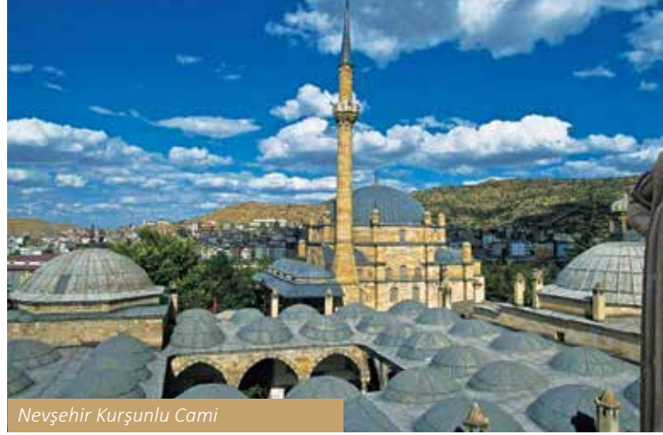
Nevşehir Kurşunlu Camii

ği 'Konukevi' ve 'Aşevi' yer alır. Meydan Evi'nin bitişiğindeki Kiler Evi'nin alt katında dergâhın kıymetli eşyaları ve yiyecekleri depo edilmekteydi. Hazret Avlusu'na ise 'Altın Kapısı'ndan girilir. Girişte hasbahçe, sağ tarafta derviş ve baba mezarları, karşı tarafta Selçuklu mimarisi özelliklerini arz eden ve Orhan Gazi zamanında yaptırılan Hacı Bektaş Veli Türbesi yer almaktadır. Hacı Bektaş'ın inzivaya çekildiği Çilehane ve Kırklar Meydanı bu bölümdedir. Hacı Bektaş'ın yeşil sandukalı türbesi, yeşil puşide ve çeşitli şamdanlarla donatılmış, kalem işi süslemeler ve yazı motifleriyle tezyin edilmiştir. Kırklar Meydanı'nın doğusunda Horasan Erleri'nin mezarları, batı tarafta çelebilere ait olduğu söylenen mezarlar ile Güvenç Abdal'ın türbesi bulunur. Hazret Avlusu'nun sağında 1519 yılında yaptırılan Hacı Bektaş'tan sonra gelen Balım Sultan Türbesi yer alır.