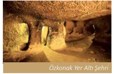
Özkonak Yer Altı Şehri

Kapadokya Bölgesi'nin en ilginç doğal ve kültürel zenginliklerinden olan yer altı yerleşimleri, farklı büyüklüklerde, 150 200 civarındadır. Ancak 25.000 km 2 bir alanı kaplayan Kapadokya Bölgesi'nin bütün kasaba ve köylerinde büyüklü küçüklü kaya yerleşimleri bulunmasından ötürü sayı daha da artabilir. Bu kaya yerleşimlerinin büyük bir kısmı yumuşak tüfün aşağıya doğru derinlemesine oyulmasıyla inşa edilmiştir. Yüzlerce odadan oluşan yer altı şehirlerindeki mekânlar birbirlerine uzun galeriler ve labirent gibi tünellerle bağlanmıştır. Galerilerin alçak, dar ve uzun olmalarının nedeni düşmanın hareketlerini kısıtlamaktır. Ayrıca bu koridorların duvarlarına