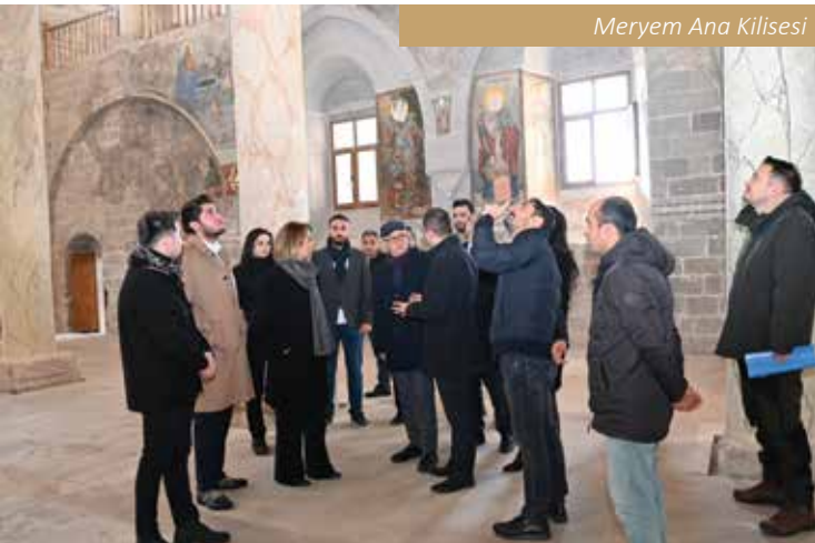
Meryem Ana Kilisesi

İnziva yaşamı, ilahiyat ve kilise hukuku konularında pek çok eseri bulunan Basileios'un öğütlediği davranış biçimleri ve doktrinleri Hristiyan toplumlari için bugün bile geçerlidir.