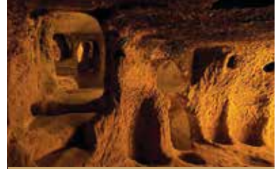
Kaymaklı Yer altı Şehri

önemli kişilere ait olup olmadığı konusu henüz açıklığa kavuşmamıştır. Yer altı yerleşimleri içinde hem havalandırma hem de haberleşme amacıyla yapılmış, çoğu zaman yer altı yerleşiminin tabanı ile bağlantılı bacalar vardır. Bu havalandırma bacaları aynı zamanda su kuyusu olarak da kullanılmaktaydı. Bazı su kuyularının ağız kısımları düşmanın suyu zehirlemesini önlemek için yeryüzü ile bağ-