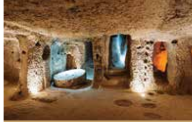
Kaymaklı Yer altı Şehri