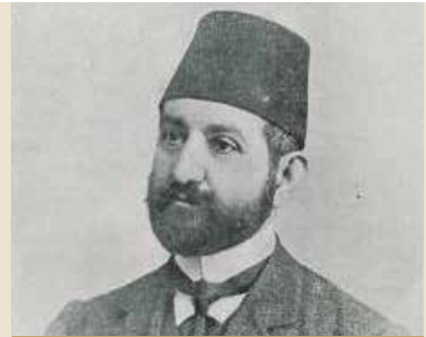
Seyhülislam Hayri Efendi