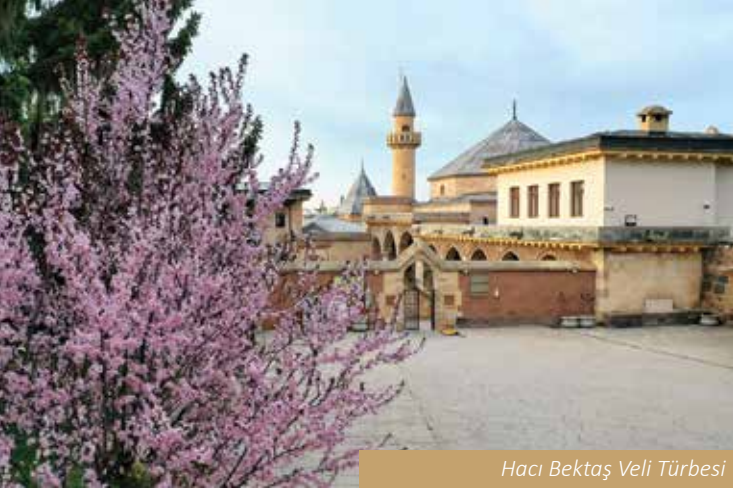
Hacı Bektaş Veli Türbesi