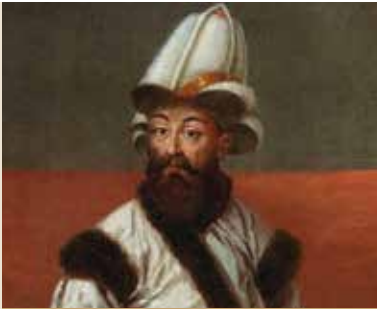
Damat İbrahim Paşa

oldukça iyi bilen Prehistorik Dönem insanların basit aletlerle yumuşak tüfü oyması zor değildi. Bu dönemde birkaç odadan ibaret olan, Kapadokya'ya gelen değişik topluluklar tarafından devamlı olarak genişletilen yer altı yerleşimleri, bir önceki kültürün tüm arkeolojik izlerini yok ederek bugünkü halini almıştır. Ancak, yer altı şehirlerinin en yaygın kullanımını Bizans Dönemi'nde olmuştur.