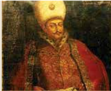
Karavezir Mehmet Paşa