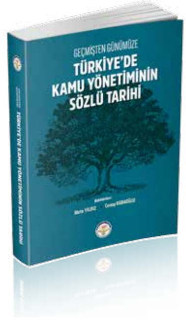
Yıldız, M. ve C. Babaoğlu (2022) Geçmişten Günümüze Türkiye'de Kamu Yönetiminin Sözlü Tarihi , Ankara: TİAV yayınları.

Ayrıca gerçekleştirilen iki değerlendirme oturumu da kitap için metinleştirilmiş, hazırlanan giriş ve sonuç bölümleriyle mülakatlar arasında bağlantılar analiz edilmiş ve çıkarımlar okuyucuya sunulmuştur. Kamu yönetimi alanında bir ilk olan bu sözlü tarih seminer serisi dijital ortama da aktarılmış ve kitap içerisinde karekodlar aracılığıyla birincil görüşmelere doğrudan erişim imkânı sağlanmıştır. Sözlü tarih çalışmasında paylaşılan bilgi ve deneyimler ile yönetim ve yöneticilik tecrübeleri, kamu yönetimi akademisyenleri ve kamu yönetimi disiplininin her yaşta öğrencileri kadar kamu yöneticileri için de eşsiz bir kaynak oluşturmaktadır.