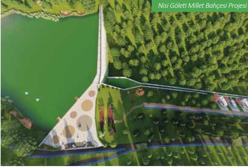
Nisi Göleti Millet Bahçesi Projesi