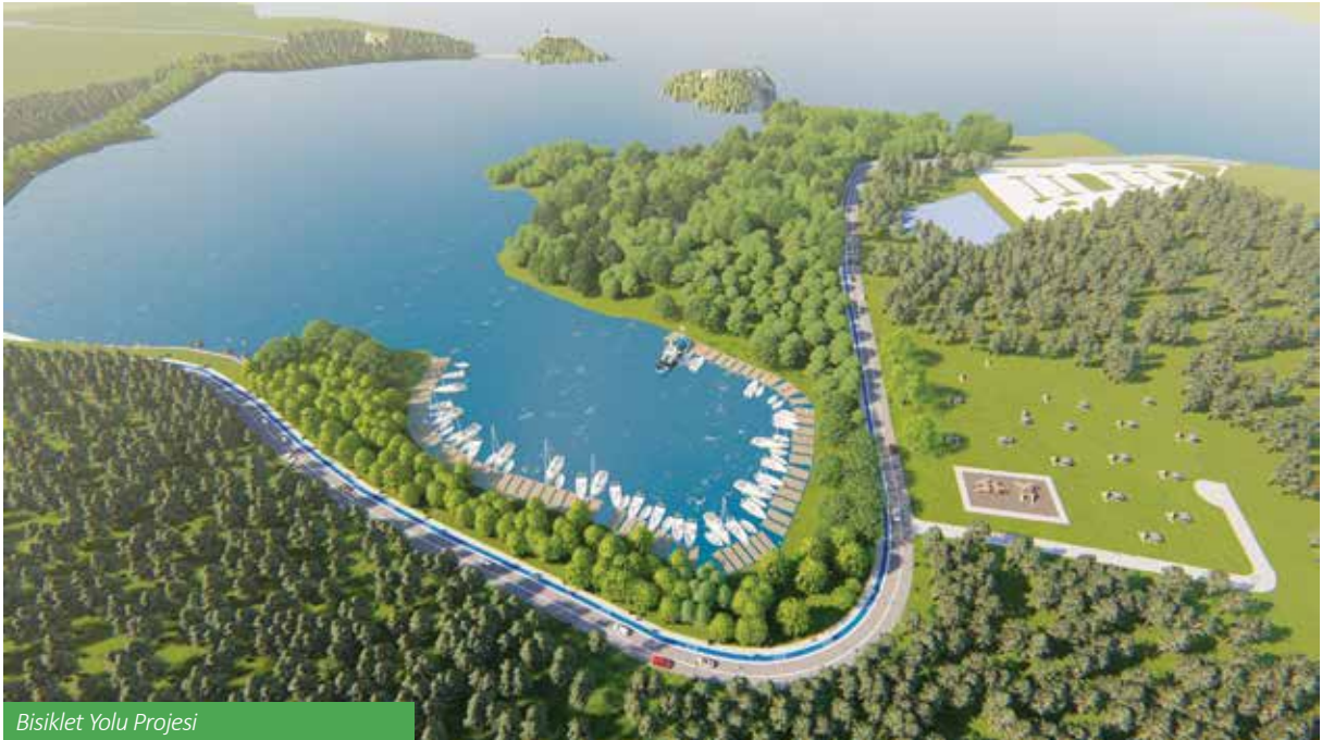
Bisiklet Yolu Projesi

Hayata geçirdiğimiz bu projelerin dışında ihale çalışmaları başlayan Akliman Tabiat Parkı içerisinde yapılacak olan bisiklet yolu ve Karakum mevkiinde bulunan Nisi Göleti'nde yapılacak iyileştirme çalışmalarının yanı sıra Akliman Bölgesi'nde yılın 12 ayı boyunca, spor turizmi ile kentimize