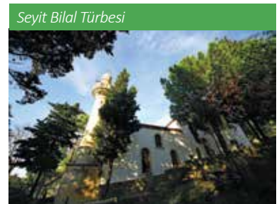
Seyit Bilal Türbesi