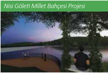
Nisi Göleti Millet Bahçesi Projesi

gerek ekonomik gerekse turizm açısından çok önemli katkılar sağlayacağına inandığımız çok yönlü bir spor kompleksi oluşturmayı planlıyoruz.