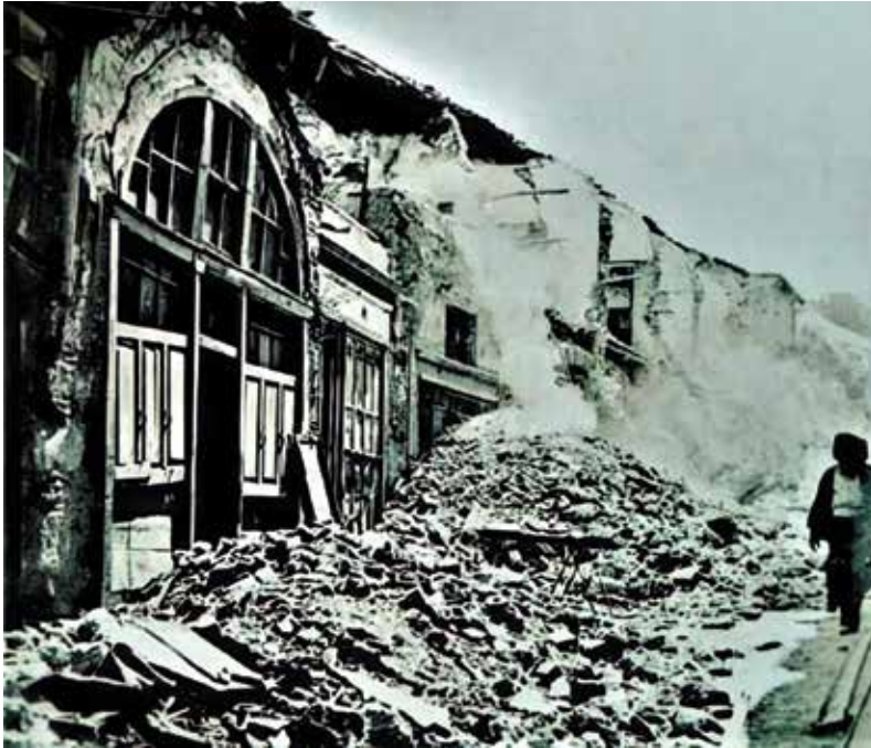
Resim 3. 1894 Depremi Sonrası Çilingirler Sokağı

Resmi rakamlara göre 1894 İstanbul'da deprem nedeniyle 474 kişi hayatını kaybetmiş, 482 kişi yaralanmış, 1087 ev ve 299 dükkân kullanılamaz hale gelmiştir (Öztin, 1994: 9). Deprem sonrasında İstanbul'da çok büyük hasar meydana gelmiştir. Depremde büyük ve küçük çaplı zarar görmeyen bina yok denecek kadar azdır. Yapılan incelemeler sonucu ahşap binaların ve iyi yapılan tuğladan ve demir ile bağlanan binaların depreme dayandıkları tespit edilmiştir. Zeminin sağlam olması, yapı malzemelerinin ve inşaatın kaliteli olması vb. hususlara geçmiş dönemde de yer verilmiştir (Sezer, 1996: 173).