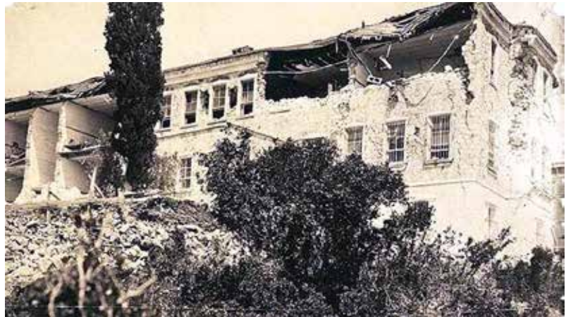
Resim 1. 1894 İstanbul Depreminde Hasar Gören Bir Yapı

10 Temmuz 1894 tarihinde öğle vaktinde İstanbul halkını yakalayan deprem sırasında insanlar kaçışmaya başlamış, bazı insanlar panikle pencereden atlayarak yaralanmış, bazıları da şaşkınlıktan yıkılmaya yüz tutan binalar ile dar sokakların arasında dona kalmıştır. Deprem sırasında Kapalıçarşı'da olan vatan-