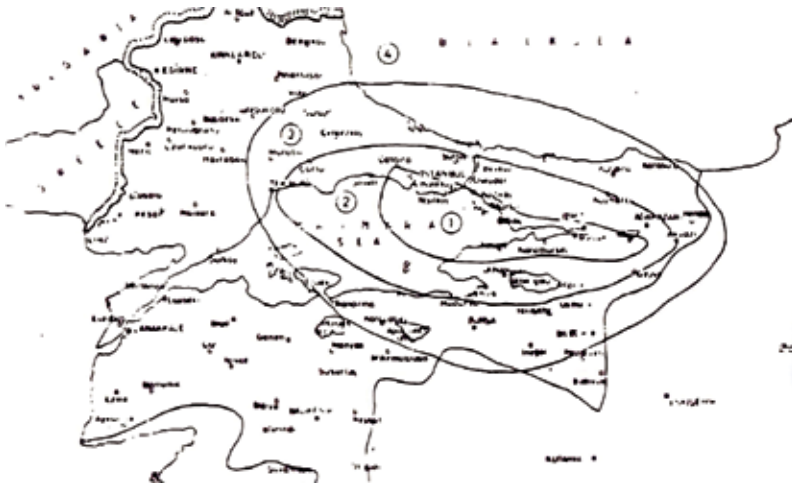
Resim 2. 1894 İstanbul Depreminin Etki Alanı

1894 Depremini bilimsel açıdan tetkik etmesi için Tabii Bilimler ve Astronomi Profesörü ve Atina Rasathanesi Müdürü olarak görev yapan Dimitrios Eginitis, Padişah II. Abdülhamid tarafından İstanbul’a davet edilmiştir. Eginitis, ekibiyle birlikte çalışmalara zarar gören yerleri ziyaret ederek başlamıştır. İncelemeler sonucunda Fransızca bir rapor yazmıştır. 15 Ağustos 1894 tarihinde Padişaha sunulan raporda “Deprem 10 Temmuz 1894 tarihinde öğleden sonra saat 12:24 sıralarında üç kez art arda şiddetli bir şekilde olmuştur. Arka arkaya bu üç sarsıntı toplam 17-18 saniye sürmüştür” şeklinde ifadeye yer verilmiştir. İncelemeyi gerçekleştiren Atina Rasathanesi Sorumlusu Eginitis ve ekip arkadaşları, valilerden gelen telgraflar ve farklı kaynaklardan aldıkları diğer bilgilere dayanarak depremin şiddetine ve süresine yönelik açık bir fikir edinmişlerdir. Rapora bakıldığında deprem Çorlu, Tekfur dağı, Mudanya, Akhisar, Üsküdar, Ortaköy, Terkos, Bandırma, Bilecik, Yanya, Bükreş, Girit, Yunanistan, Konya ve Anadolu’nun büyük kısmı, çok hafif olarak Avrupa, Asya ve Afrika’nın bir kısmında hissedilmiştir. İngiltere’de, Birming-