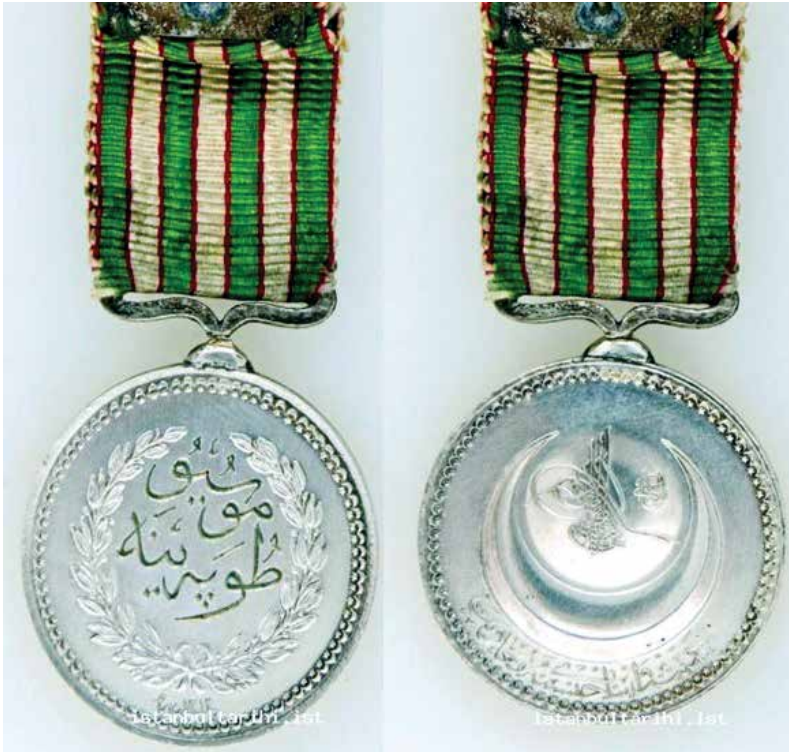
Resim 4. Deprem Bağışçalarına Verilen Devlet Madalyasının Ön ve Arka Yüzü

Depremi ilk anından itibaren yemek ve geçici barınma işlerini Şehremaneti (Belediye) karşılamıştır. Ancak gün geçtikçe Şehremaneti'nin bütçesine yük oluşması ile birlikte masrafların İane Komisyonundan karşılanması istenmiştir. İane Komisyonu ilk etapta evi yıkılanlara yardım edeceğini bildirmiş, ancak tespit işlemlerinin uzun süreceği anlaşılınca barınma yeri olmayanlara 1.000.000 liralık yardımın acil ihtiyaç sahiplerinden başlanarak dağıtılmasına karar vermiştir. İane Komisyonu, hasarlı evlerin hasar