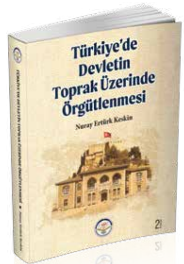
Keskin, N. E. (2022) Türkiye'de Devletin Toprak Üzerinde Örgütlenmesi , 2. Baskı, Ankara: TİAV.

Türkiye'de Devletin Toprak Üzerinde Örgütlenmesi, kamu reformları sürecine bilimsel bir bakış geliştirmenin yanında, yönetim kuramına da katkı sağlayabilirse amacına ulaşmış olacaktır.