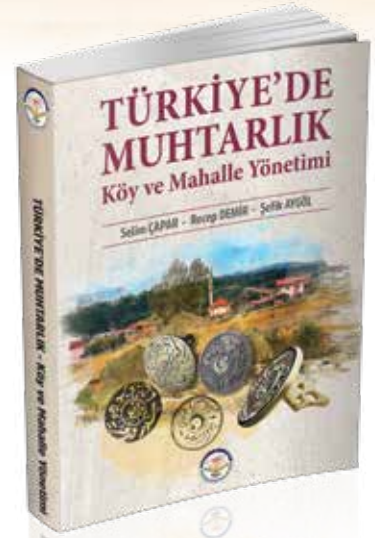
Çapar, S., Demir, R. ve Ş. Aygöl (2022) Türkiye'de Muhtarlık , Ankara: TİAV.

Bu çalışmada köy yönetimi ve mahalle yönetimi ayrı başlıklar altında ele alınmakla birlikte, her ikisinin de ortak ele alındığı başlıklar da bulunmaktadır. Köy ve mahallenin yönetim organlarının görev, sorumluluk, hak ve yetkilerine ilişkin değerlendirmelerde ağırlıklı olarak mevzuat ve hukuki analizler esas alınmıştır. Ancak çalışmanın bütününde, farklı bakış açılarıyla da analizler yapılmıştır.