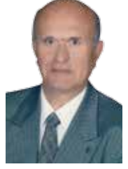
Erdi BATUR (E) Vali

Göçler ilk çağlardan başladı, orta çağların sonlarına kadar sürdü. Bu dönem süresi içinde birçok Türk boyu orta Asya'dan Hindistan, Uzakdoğu, orta Avrupa ülkelerine göç ettiler. Bu göçler sonunda birçok Türk devleti kuruldu.