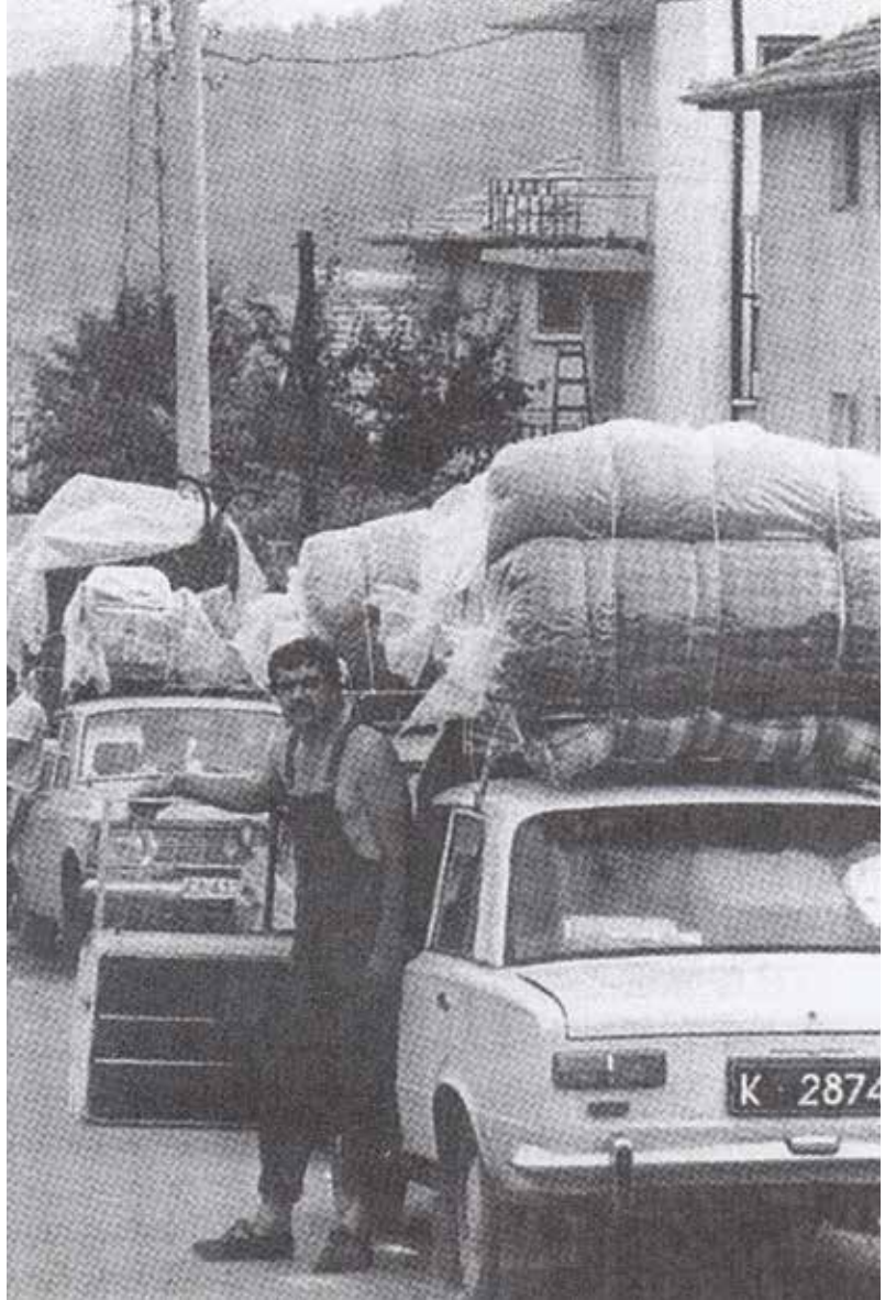
Geri tepiş: 19. ve 20. yüzyıllarda güçlenen Avrupa, Rusya ve Çin Orta Çağ'da topraklarına hükmetmiş Türkleri geri püskürttü. Fotoğrafta, 1989'da toplu göç ile Türkiye'ye gelen Bulgar Türkleri görülüyor.