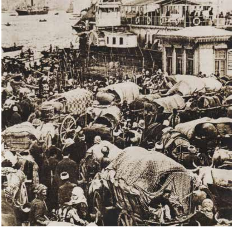
1. Balkan Savaşı yenilgisi üzerine Rumeli'deki Bulgar ve Yunan zulmünden kaçan halk, Asya tarafına geçmek için Eminönü iskelesinde bekliyor.

Babil Kulesi; Eski çağların 7 harikasından biri olan kule, tanrı Marduk