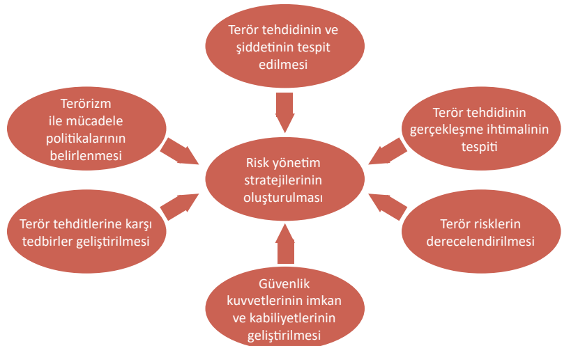
Şekil 2. Terörizmle mücadelede risk yönetim stratejilerinin oluşturulması (Yazar tarafından oluşturulmuştur).