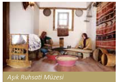
Aşık Ruhsatı Müzesi