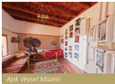
Aşık Veysel Müzesi