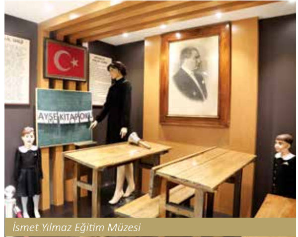
İsmet Yılmaz Eğitim Müzesi