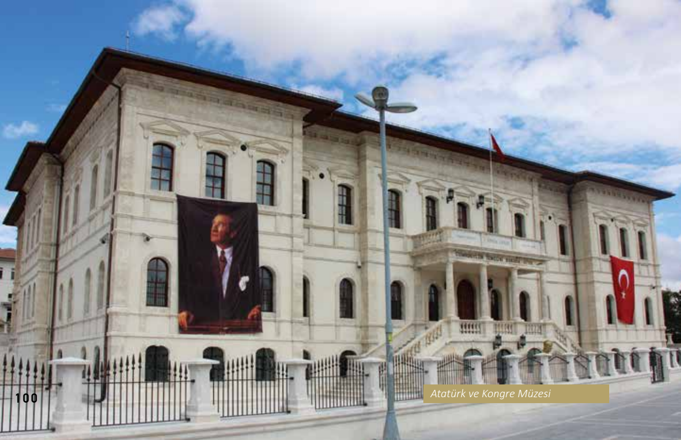
Atatürk ve Kongre Müzesi