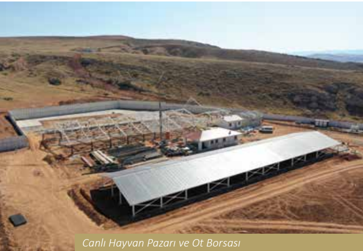
Canlı Hayvan Pazarı ve Ot Borsası