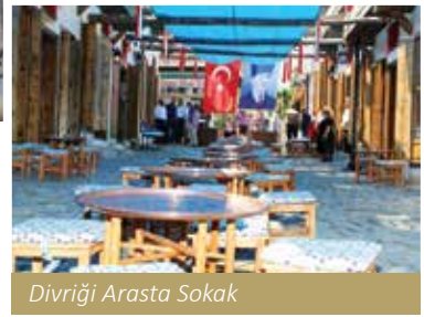
Divriği Arasta Sokak

dirdiğimiz Divriği Arasta Sokak Sağlıklaştırma ve Seyir Terasları Projesi ile Divriği'yi turizm açısından önemli bir merkez konumuna getireceğiz.