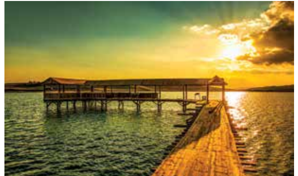
Zara Tödürge Gölü