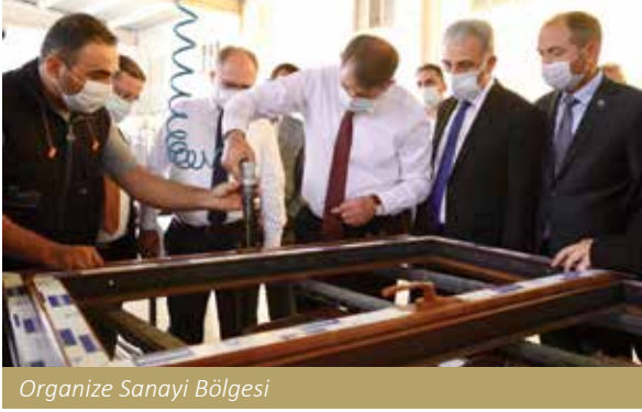
Organize Sanayi Bölgesi