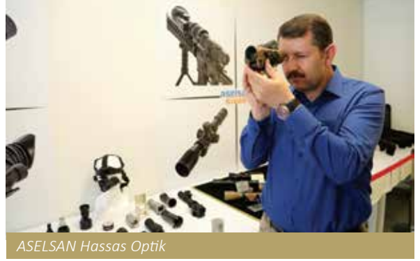
ASELSAN Hassas Optik