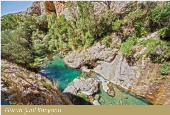
Gürün Şuul Kanyonu