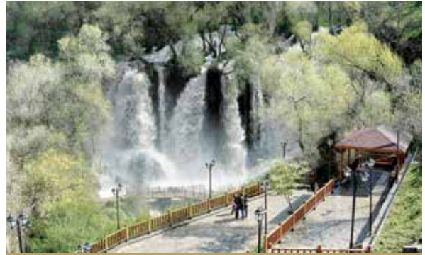
Gemerek Sızır Şelalesi