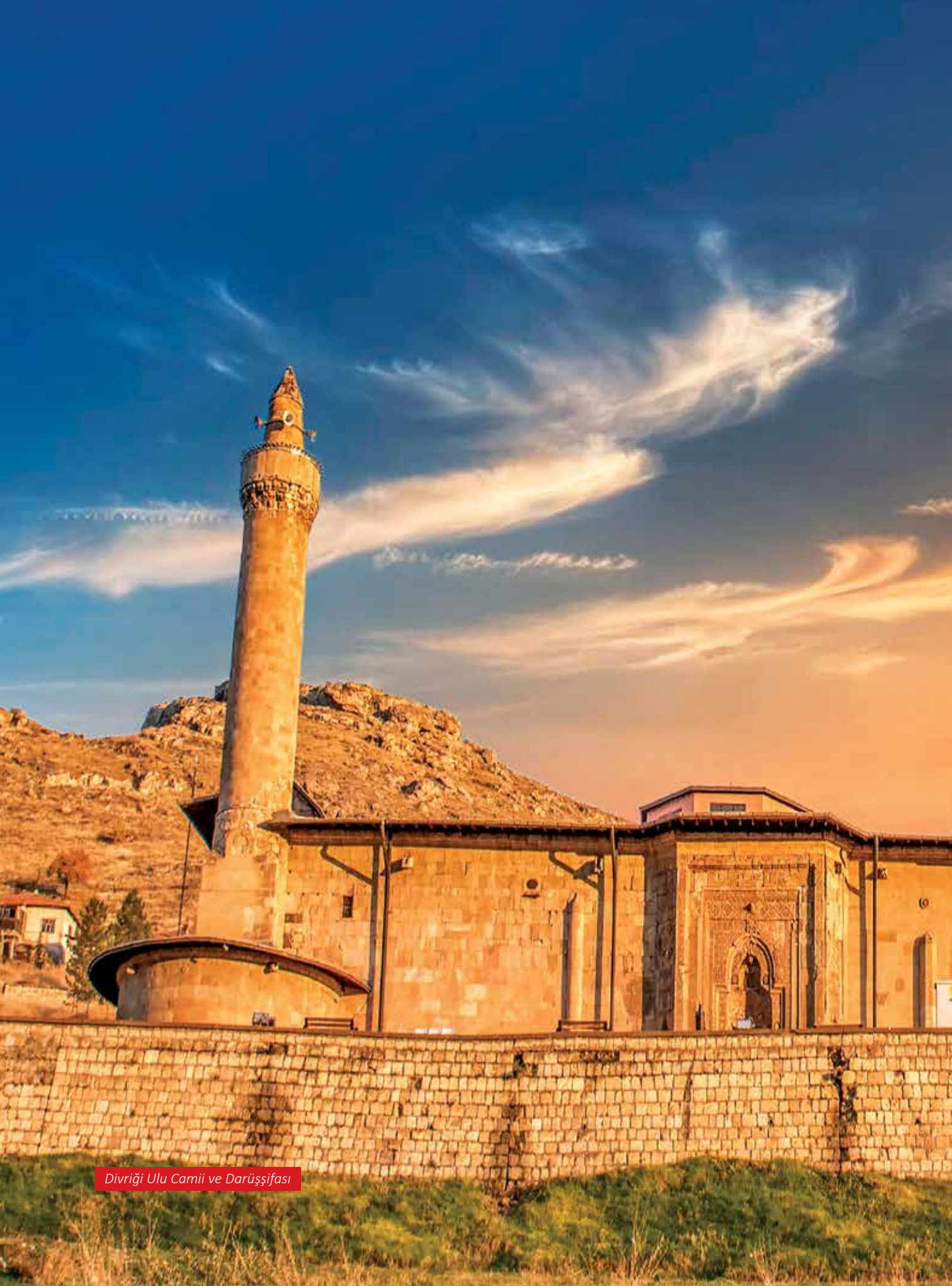
Divriği Ulu Camii ve Darüşşifası