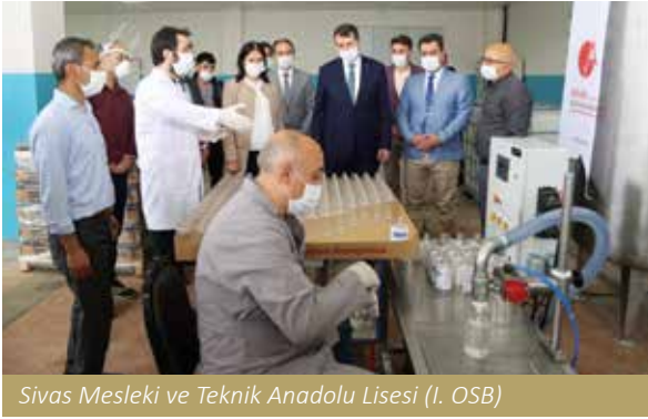
Sivas Mesleki ve Teknik Anadolu Lisesi (I. OSB)