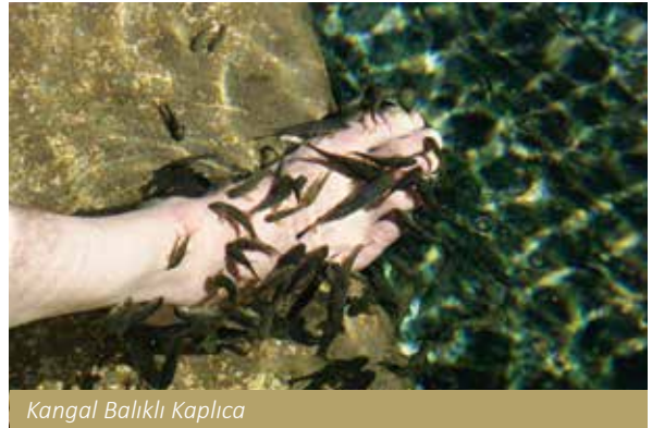
Kangal Balıklı Kaplıca