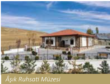
Âşık Ruhsati Müzesi