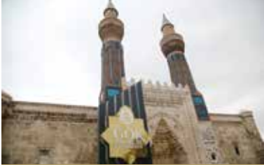
Gökmedrese Vakıf Müzesi

Aletleri Müzesi ve Hamam Müzesi ile ilgili projelendirme çalışmalarımız da devam ediyor.