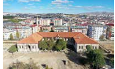
Şehir Sanayi Müzesi