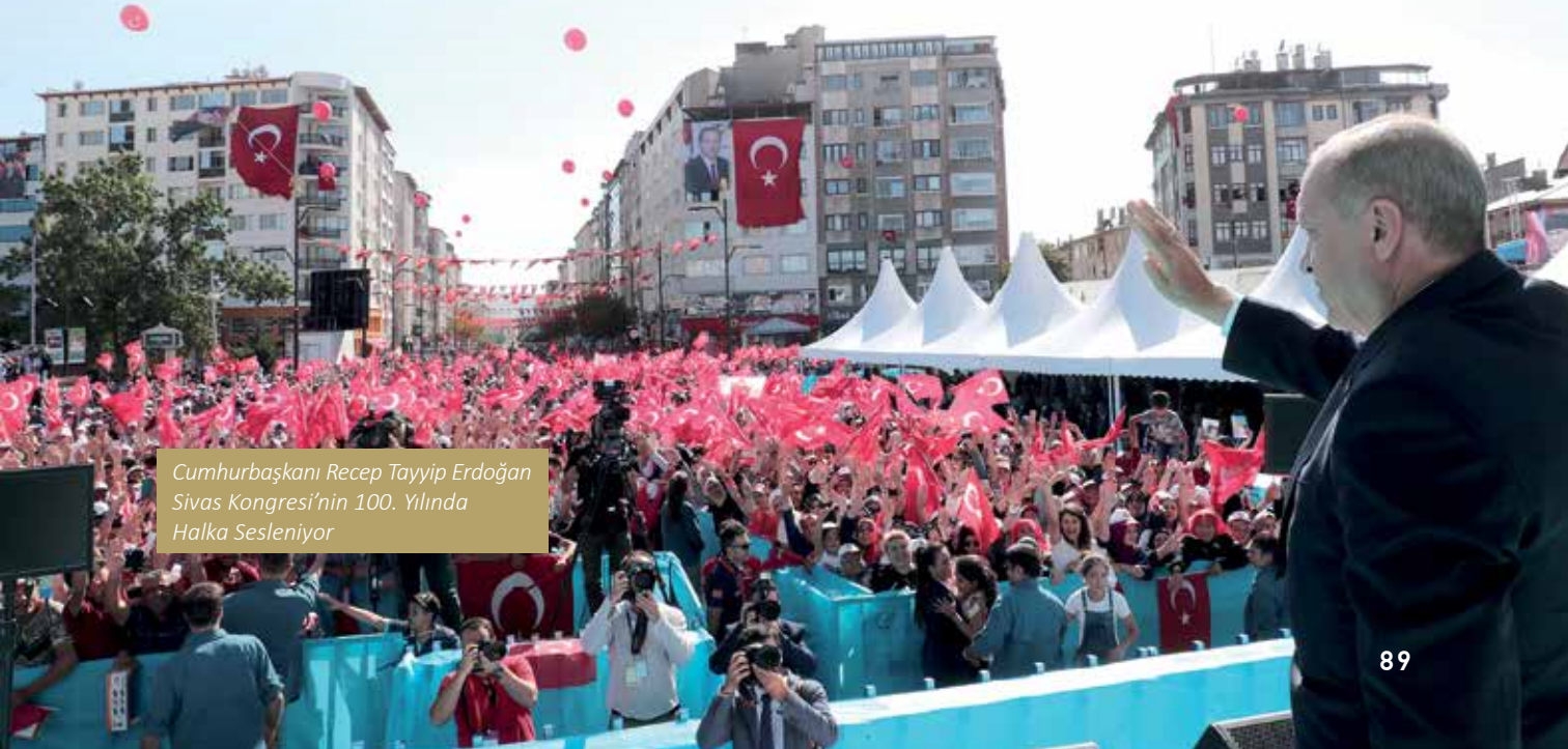
Cumhurbaşkanı Recep Tayyip Erdoğan Sivas Kongresi'nin 100. Yılında Halka Sesleniyor