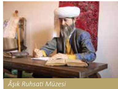
Âşık Ruhsati Müzesi