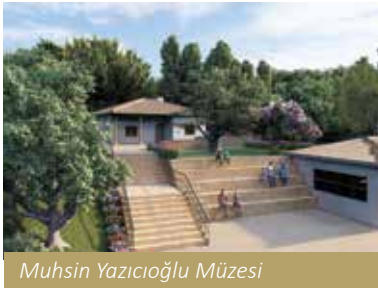
Muhsin Yazıcıoğlu Müzesi

Şehrimizin kültürel mirasını korumak ve gelecek kuşaklara aktarmak adına da birçok çalışma yürütüyoruz. Bu konuda manevi anlamda bizim için önemli olan iki projeyi hayata geçirdik. Sivas'ın yetiştirdiği önemli devlet adamlarından biri olan Muhsin Yazıcıoğlu'nun evini ve bulunduğu havzayı restore ederek bir müze haline getirdik. Yine ülkemizin önemli değerlerinden biri olan Âşık Ruhsati'nin köyünde bulunan evi restore ederek burayı bir müze haline getirdik.