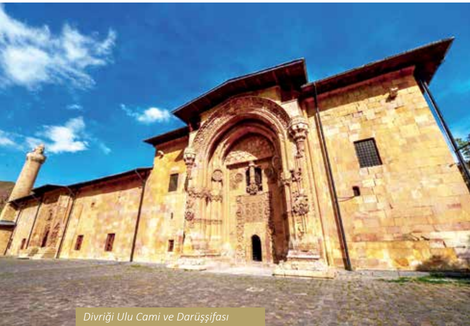
Divriği Ulu Cami ve Darüşşifası

Sivas, tarihin her döneminde, bulunduğu coğrafyanın ve topraklarında kurulan her yönetimin ve medeniyetin en önemli şehirlerinden birisi olmuştur hep... Sivas, coğrafi konumu, askeri ve ekonomik yapısı itibarıyla tarihin kırılma noktalarında meydana gelen olaylara tanıklık etmiştir.