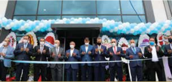
Organize Sanayi Bölgesi Tayfx Hassas Optik

kazanan Sivas, Anadolu topraklarının bereketini gelecekte de tüm ülkeyle paylaşmaya devam edecektir.