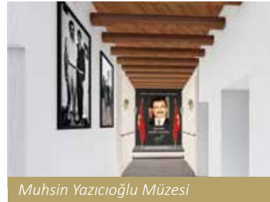
Muhsin Yazıcıoğlu Müzesi