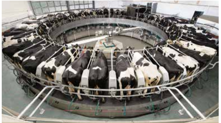
Şarkışla Tarıma Dayalı İhtisas OSB