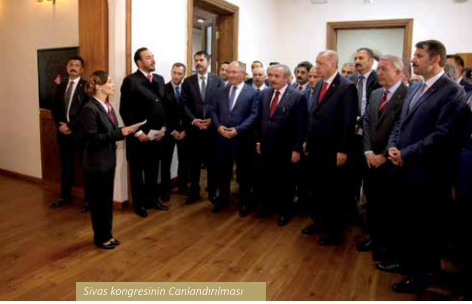
Sivas kongresinin Canlandırılması

4 Eylül Sivas Kongresi Türkiye Cumhuriyeti'ne giden yolda önemli bir dönüm noktasıdır. Kongre'nin 100. yılında Valilik olarak yapılan çalışmalar ve etkinlikler nelerdir?